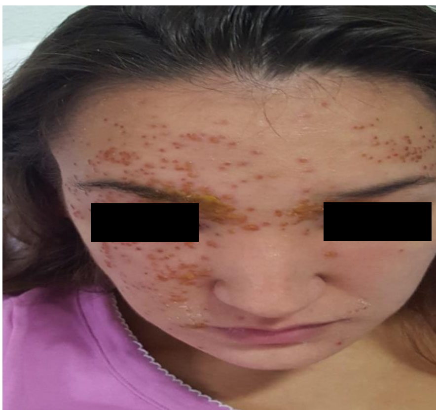
Slika 3. Diseminirane promjene su izražene na čelu i obrazima.