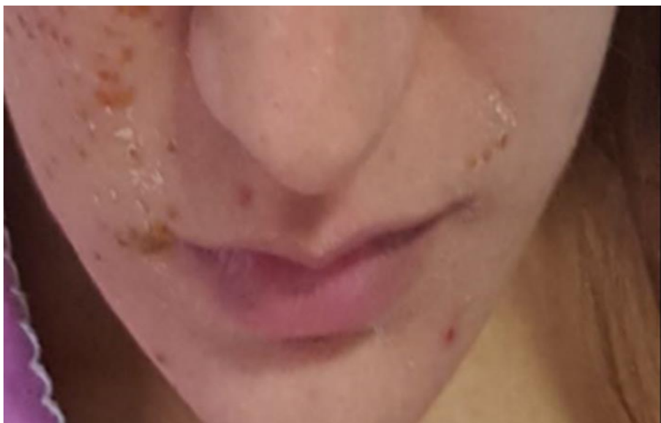
Slika 2. Promjene se šire od gornje usnice prema čelu.