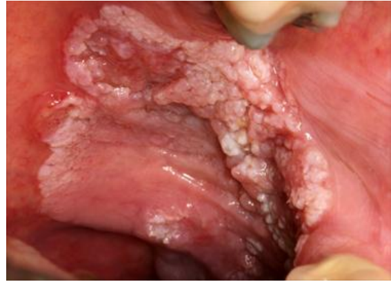
Slika 1. Tipični izgled HPV+ OPSCC kod nepušača. Prema: Murphy (2014), Oral vs. Oropharyngeal Cancer, Compare & Contrast, str. 2

Unatoč povećanoj incidenciji HPV+ OPSCC te poznatim rizičnim faktorima, ne postoji standardizirani screening test koji bi se koristio za ranu detekciju HPV lezija u orofarinksu (57). Za dijagnozu HPV+