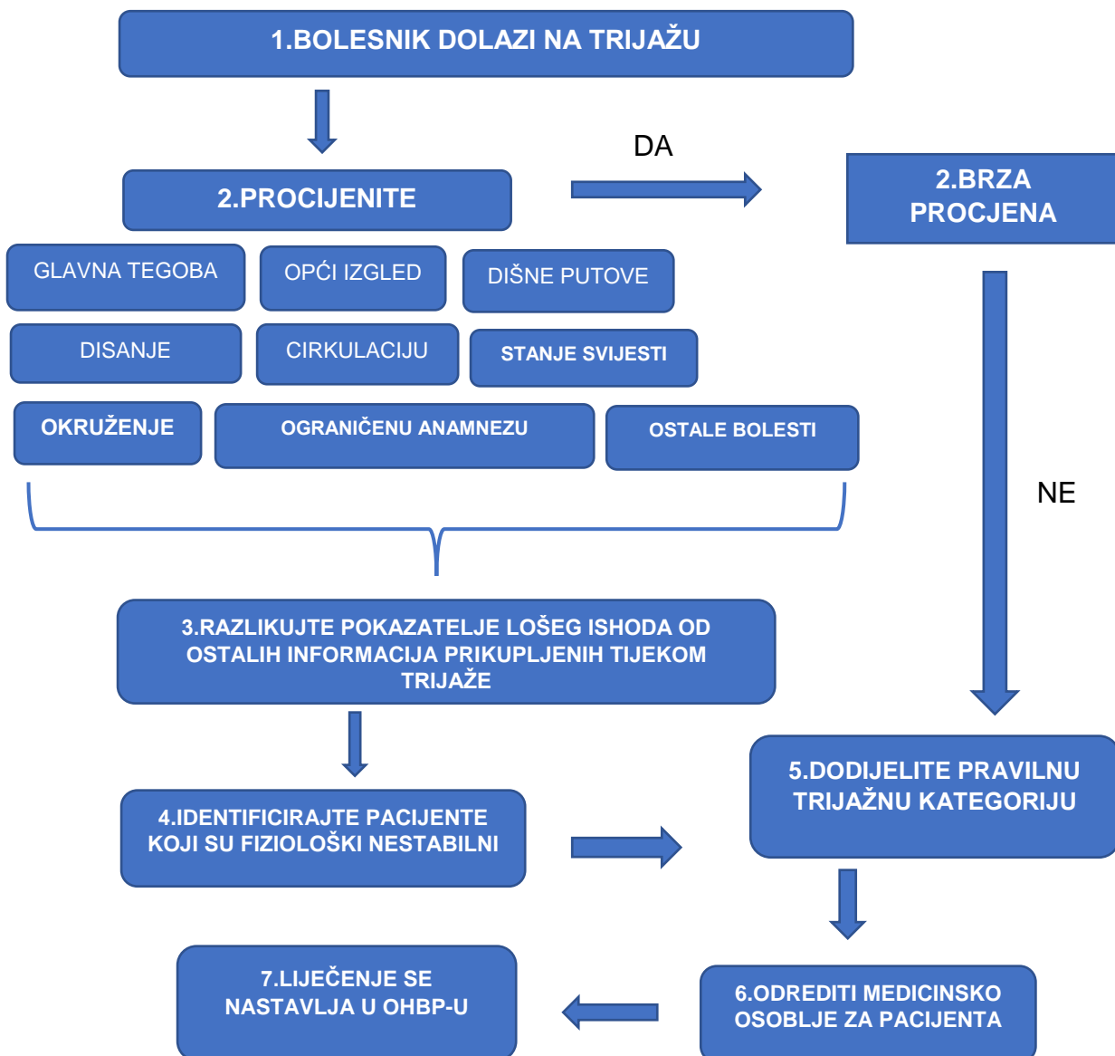
Slika 2. Preporučeni proces trijaže

Druga kategorija podrazumijeva stanja koja zahtijevaju zbrinjavanje bolesnika unutar 10 min, prijeteću životnu ugroženost. Treća kategorija bolesnika mora biti zbrinuta unutar 30 min, a četvrta kategorija unutar 60 min. U petu kategoriju spadaju manje hitna stanja, te kliničko administrativni problemi s početkom obrade unutar 120 min (Slavetić & Važanić 2012). Trijažni proces na slici 2.