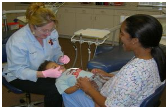
Slika 4. Položaj malog djeteta u ordinaciji

osjećaj simpatije i povjerenja. To se postiže prije svega uvažavanjem različitosti i stvaranjem ugodne okoline. Elementi koji trebaju biti prisutni su empatija, poštovanje, iskrenost, entuzijizam, upornost, poštenje, ljubaznost, uvažavanje mišljenja, prepoznavanje tuđih potreba, smisao za humor i nagrađivanje. Sve to iziskuje veliko znanje i stalno obrazovanje i vježbanje, iz područja razvojne psihologije i komunikacijskih vještina jer nije jednak pristup svim dobnim skupinama. (Zarevski et al. 2005)