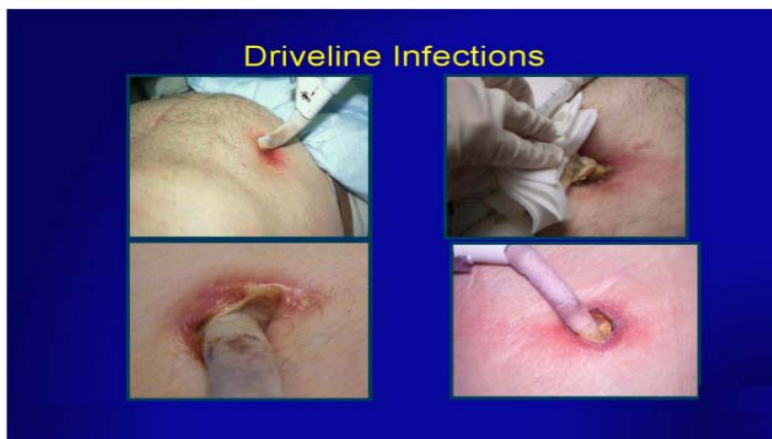
Slika 10: Infekcija mjesta izlazišta perkutanog kabela