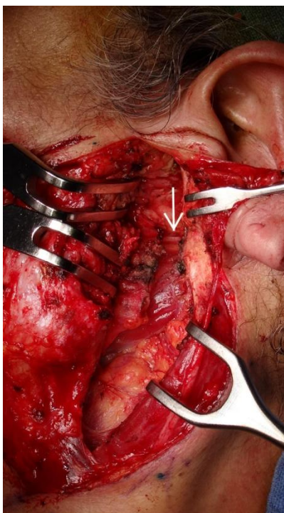
Slika 5. Modificirana incizija po Blairu s prikazanim ličnim živcem. [41] (Preuzeto:

Kirurško liječenje benignih tumora parotidne žlijezde uključuje potpuno odstranjenje neoplazme uz odgovarajući resekcijski rub kako bi se izbjegla pojava recidiva. Budući da nam patohistološka dijagnoza parotidne mase često nije poznata prije operacije, minimalna procedura koju je potrebno učiniti jest površinska parotidektomija uz očuvanje ličnoga živca što je ujedno i kurativna metoda za benigne tumore parotidne žlijezde. Pri tome je lični živac potrebno prikazati u području njegova glavnog stabla, proksimalno od žlijezde. Obično se učini modificirana incizija po Blairu koja započinje ispred heliksa uške, širi se inferiorno prema uvuli te nastavlja prema vratu paralelno s korpusom mandibule i 2 cm ispod njega. Zbog estetskih razloga može se koristiti i tzv. facelift incision . Kako bi se izbjegla ozljeda ličnog živca, operacijsko polje je prikazano široko pri čemu sternokleidomastoidni mišić i stražnji trbuh digastričnog mišića služe kao anatomska obilježja. Također, prikaže se i hrvkavični dio vanjskog zvukovoda, tragus uške i timpanomastoidna sutura kao dodatna obilježja pomoću kojih možemo prikazati ekstratemporalno stablo ličnoga živca ( slika 5 ).[41]