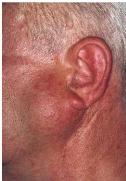
Slika 3. Prikaz šezdesetogodišnjaka s Warthinovim tumorom lijeve parotidne žlijezde.[16]