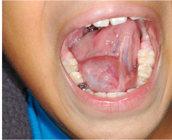
Slika 4. Preoperativni prikaz ranule.[31]