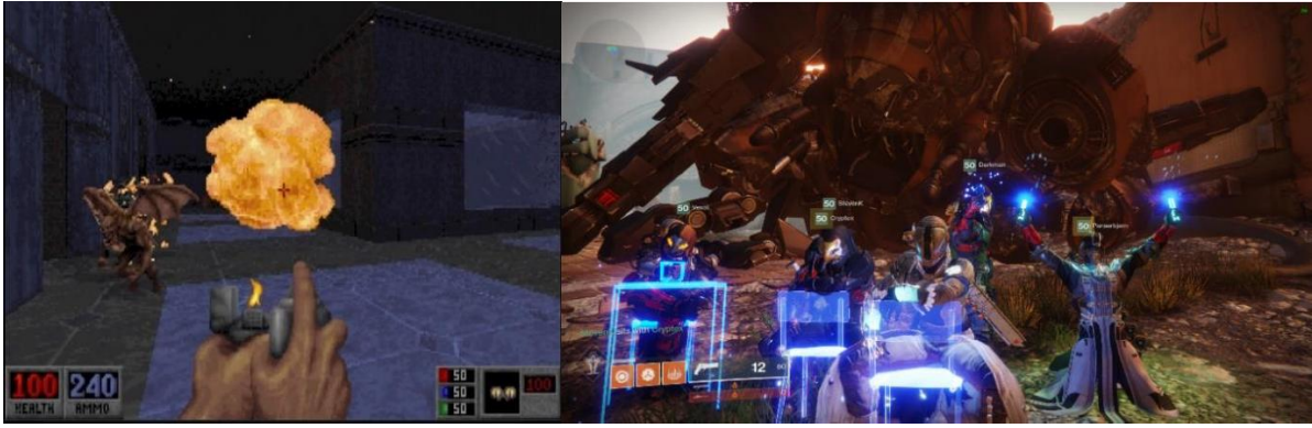
Slika 1 – Blood igra iz 1997. (lijevo) (1); iz vlastite arhive: Destiny 2 igra u 2019. (desno)