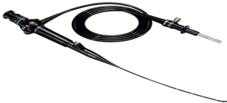
Slika 2: Fleksibilni histeroskop

Za dijagnostičku histeroskopiju koriste se košuljice histeroskopa promjera do 5mm, što znači da nema znatne dilatacije cerviksa. Kod operacijske histeroskopije košuljice imaju veći promjer. Za zahvate se mogu koristiti mehanički ili elektrokirurški instrumenti te laser. Košuljice omogućavaju i dopremu distendirajućeg medija, koji je potreban budući da je materijšte virtualan prostor.