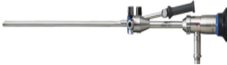
Slika 1: Rigidni histeroskop