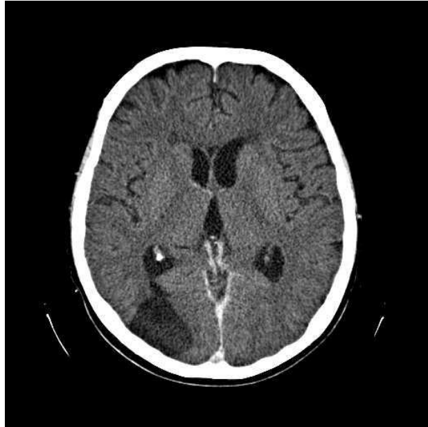
Slika 2. CT prikazi pacijentice s moždanim metastazama karcinoma pluća. Prosinac 2017.

U prozoru za meke česti okcipitalno, desno, parasagitalno, kortiko/subkortikalno vidljiva hipodenzna trokutasta, oštro ograničena zona malacije vezana uz okcipitalni rog desne lateralne komore koja odgovara postiradijacijskoj malaciji.