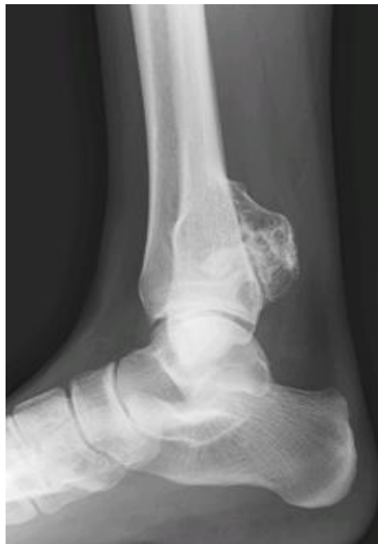
Slika 4. Rendgenska snimka gležnja na kojoj je vidljiv osteohondrom distalne tibije.

Egzostoze gležnja često mogu proći nezapaženo. Uobičajeno se simptomi javljaju u drugom desetljeću života sa smanjenim opsegom pokreta u gležnju, palpabilnim tumorom i boli (3). Egzostoze gležnja utječu na rast ekstremiteta, uzrokuju bol, slabost, smanjen opseg pokreta te deformitet. Od deformiteta najčešći je valgus gležnja te ga nalazimo u polovice pacijenata s MHE (4,44). Skraćenje fibule, prouzrokovano egzostozom distalne tibije (Slika 4), najčešći je uzrok valgusa gležnja, a takva deformacija može dovesti i do medijalne subluksacije talusa i ranog razvoja osteoartritisa (4,44,45).