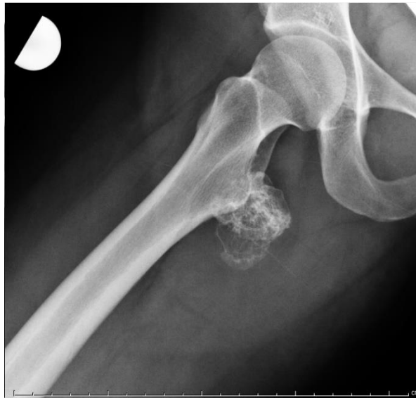
Slika 2. Lauensteinova rendgenska snimka kuka na kojoj je vidljiv osteohondrom iza malog trohantera femura.

Egzostoze u području proksimalnog femura tj. u području kuka najčešće nalazimo proksimalno od malog trohantera (Slika 2). S takvim osteohondromima usko je vezana i coxa valga koju nalazimo u 25% pacijenata s tumorom te lokalizacije te anteverzija femura tj. fleksijska kontraktura (4,5). Deformacije na medijalnoj strani femura uključujući i acetabularne egzostoze su rijetke, ali mogu uzrokovati acetabularnu displaziju (3,42). Valgus kuka već u ranoj dobi može zahtijevati varus osteotomije (42).