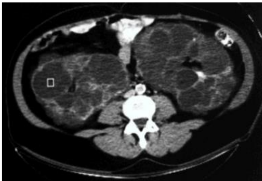
Slika 2. CT prikaz policistične bubrežne bolesti (102)