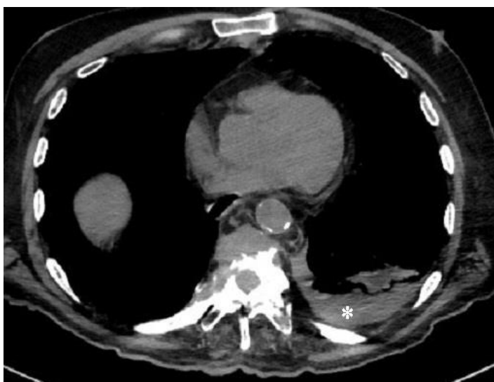
Slika 3: Hematotoraks- hemoragični pleuralni izljev lijevo (zvjezdica) u bolesnika s frakturom torakalne kralježnice

kompresijskih ozljeda intratorakalne strukture udaraju fiksni koštani okvir rebara i kralježnice što može rezultirati kontuzijom ili laceracijom plućnog parenhima, pneumotoraksom ili hematotoraksom, ozljedama traheobronhalnog stabla ili pucanjem dijafragme. Kod ozljeda usporavanja nastaje sila koja uzrokuje izravnu kompresiju na fiksne točke prsne šupljine. Ta vrsta ozljede je najčešća i potencijalno smrtonosna ozljeda, a može uzrokovati velike traheobronhalne lezije, kontuziju srca, rupturu aorte i dijafragme. Eksplozivne ozljede su danas sve češće, uglavnom djeluju na dišni, gastrointestinalni i auditorni sustav, tj. na granicu zraka i tkiva (18). Djelovanje traume na pleuru rezultirat će nastankom pneumotoraksa ili hematotoraksa (slika 3). U 30-40% slučajeva traume javlja se pneumotoraks, najčešće povezan s frakturama rebara (na rendgenskim snimkama se frakture dijagnosticiraju na temelju prisutnosti frakturnih pukotina te dislokacije frakturnih ulomaka (19)) koje uzrokuju laceraciju pluća, dok se u otprilike 50% slučajeva razvija hematotoraks, pri kojem se krv u pleuralnom prsotoru nakuplja iz različitih izvora kao npr. parenhima pluća, stijenke prsnog koša, velikih krvnih žila, srca, pa čak moguće i jetre i slezene kroz rupturiranu dijafragmu. Ako se pregledom ustanovi traheobronhalna ozljeda mora se odmah posumnjati na postojanje