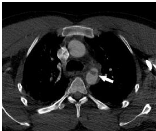
Slika 5: Traumatska lezija istmusa aorte (strelica) prikazana CT-angiografijom

Najsmrtonosnije ozljede kod bolesnika s traumom prsnog koša su kardiovaskularne ozljede. U radiološkoj obradi CT može pokazati hematopneumoperikard, kontuziju srca kao hipodenzno žarište, ekstravazaciju kontrastnog sredstva u perikard ili medijastinum, ozljedu koronarne arterije