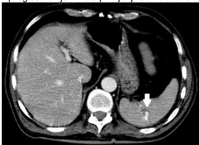
Slika 6: Laceracija slezene sa znakovima aktivnog krvarenja na CT pregledu (strelica)

Ozljede jetre su, kao i ozljede slezene, česte. Većinu tupih ozljeda