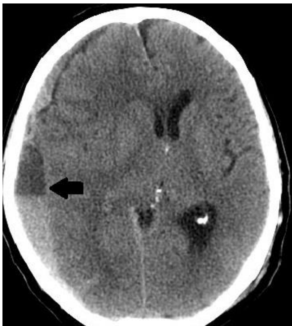
Slika 1: Subduralni hematom desno (strelica) s kompresijom desne hemisfere velikog mozga i subfalcinom hernijacijom