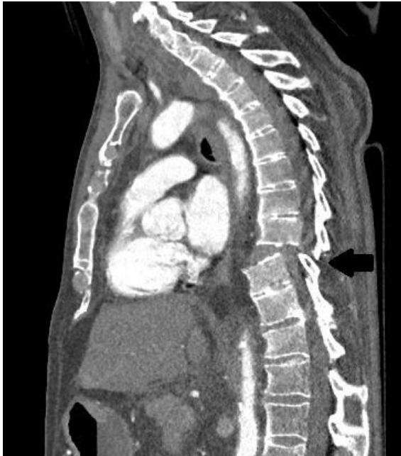
Slika 2: Fraktura Th9 i Th10 kralješka s rupturom intervertebralnog diska i dorzopozicijom trupa Th9 u odnosu na Th10 (strelica)

intoksikaciji, odsutnost bolnih ili sumnjivih ozljeda. Kada postoji sumnja na ozljedu vratne kralježnice često se u radiološkoj obradi koristi široko dostupno rendgensko snimanje. Na snimkama mora biti prikazano tijelo prvog vratnog kralješka te lateralni dijelovi atlanto-aksijalnog zgloba. Iako je rendgensko snimanje dostupno i često upotrebljavano, postoje mnogi nedostaci.