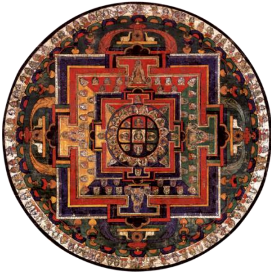
Slika 1. Mandala