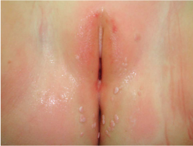
SLIKA 2. CONDYLOMATA ACUMINATA ANOGENITALNE REGIJE U ČETVEROGODIŠNJE DJEVOJČICE

FIGURE 2. ANOGENITAL CONDYLOMATA ACUMINATA IN A 4 YEAR OLD GIRL