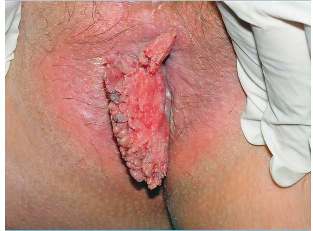
SLIKA 3. CONDYLOMATA ACUMINATA PERIANALNO U 32. TJEDNU TRUDNOĆE

FIGURE 2. ANOGENITAL CONDYLOMATA ACUMINATA IN A 4 YEAR OLD GIRL