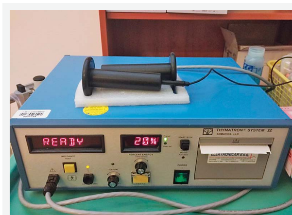
SLIKA 3. UREĐAJ ZA PRIMJENU EKT-A U KLINICI ZA PSIHIJATRIJU, KBC ZAGREB

Kao prije svakog medicinskog zahvata obavlja se priprema bolesnika. Ona uključuje fizičku i psihološku