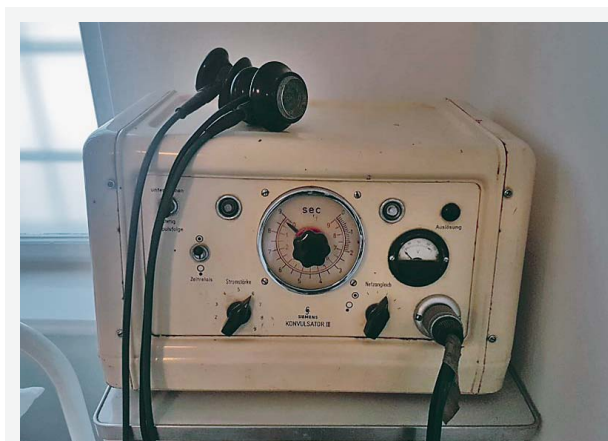
SLIKA 1. UREĐAJ ZA PRIMJENU EKT-A, MUZEJ KLINIKE ZA PSIHIJATRIJU VRAPČE FIGURE 1. DEVICE FOR THE APPLICATION OF ECT, MUSEUM OF UNIVERSITY PSYCHIATRIC HOSPITAL VRAPČE

Prvi uređaj za primjenu EKT-a u Hrvatskoj prikazuje slika 1.