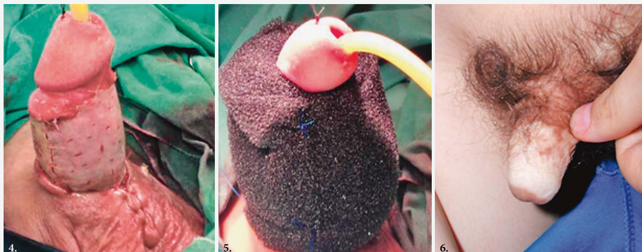
SLIKA 4. PENOPLASTIKA KOŽNIM PRESADKOM PRIJE POSTAVLJANJA SUSTAVA VAC FIGURE 4. PENOPLASTY WITH SKIN GRAFT BEFORE SETTING UP THE VAC SYSTEM