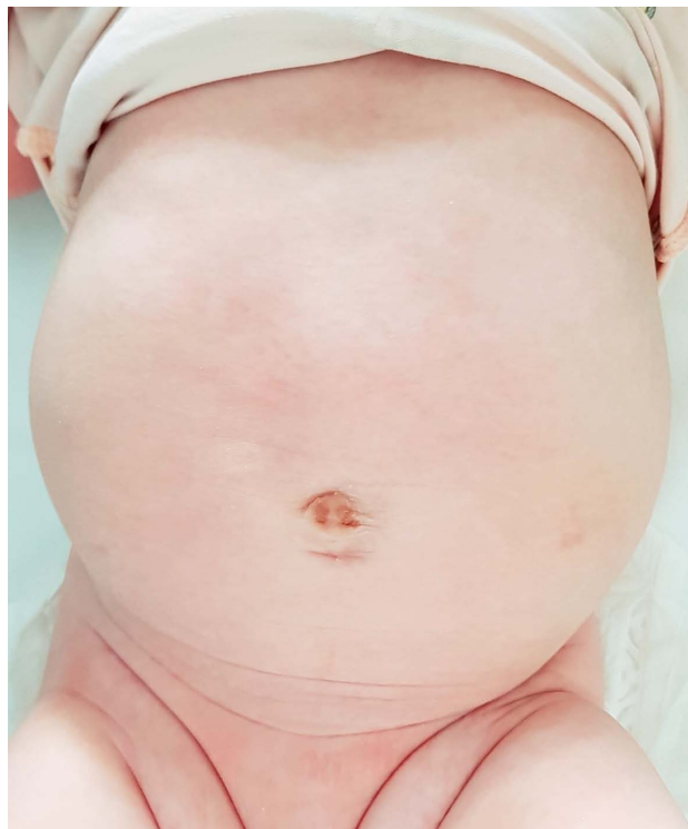
SLIKA 4. DOBAR POSTOPERATIVNI IZGLED 4 MJESECA NAKON OPERACIJE

FIGURE 4. GOOD COSMETIC RESULTS FOUR MONTHS POSTOPERATIVELY