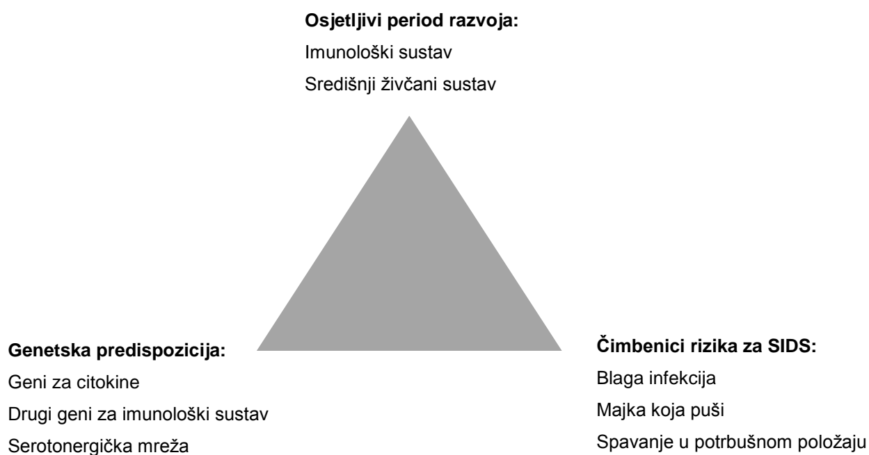
Slika 1. Koncept fatalnog trokuta SIDS-a, Preuzeto iz: Rognum TO, Saugstad OD. Biochemical and immunological studies in SIDS victims. Clues to understanding the death mechanism. Acta Paediatr Suppl [Internet]. 1993 Jun;82 Suppl 389:82–5. Dostupno na: http://www.ncbi.nlm.nih.gov/pubmed/8374202

Sljedeći predloženi model je Rognumov i Saugstadov „fatalni trokut“ koji govori o konceptu „tri udarca“, ali uzima u obzir i ulogu hipoksije i karakteristike imunološkog sustava. (51) Po tom su modelu čimbenici koji dovode do smrtnog ishoda opet razvrstani u 3 kategorije: ranjivost CNS-a, predisponirajući čimbenici (genetska obilježja) i događaji koji su okidači (prekomjerna stimulacija imunološkog sustava koji je još u razvoju).