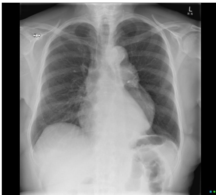
Slika 2. Vidljiva kalcifikacija luka aorte na radiografu. Preuzeto sa Aortic aneurysm on chest, case pridonio Hacking C.

dostupno na: https://radiopaedia.org/cases/aortic-aneurysm-on-chest-radiograph (21).