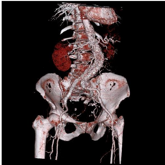
Slika 5. Trodimenzionalna računalna rekonstrukcija AAA nakon CT-angiografije.