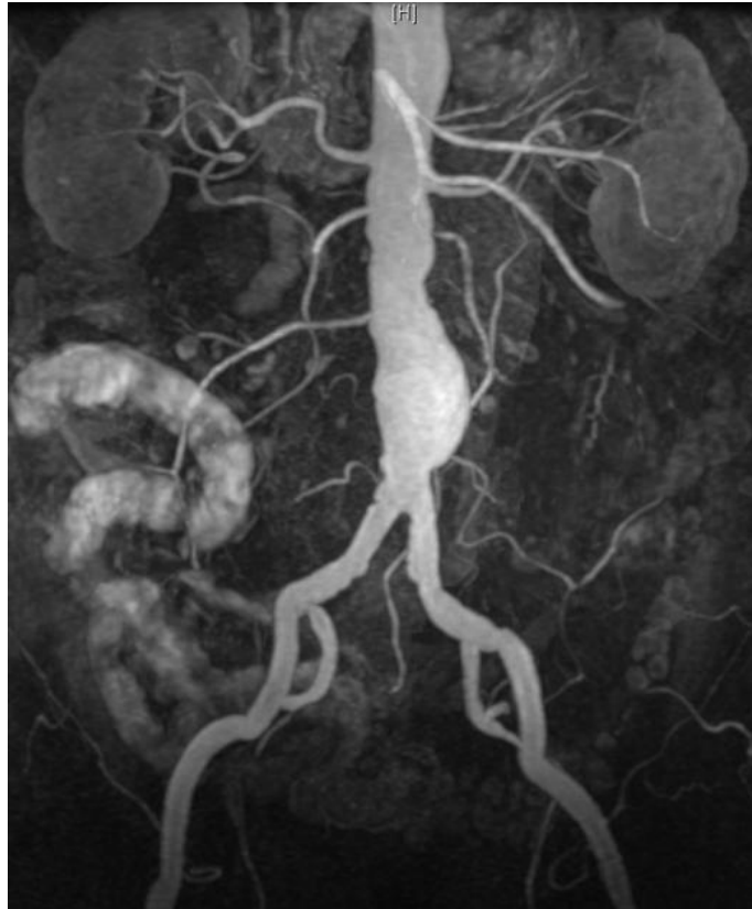
Slika 6. MR infarenalne aneurizme aorte.