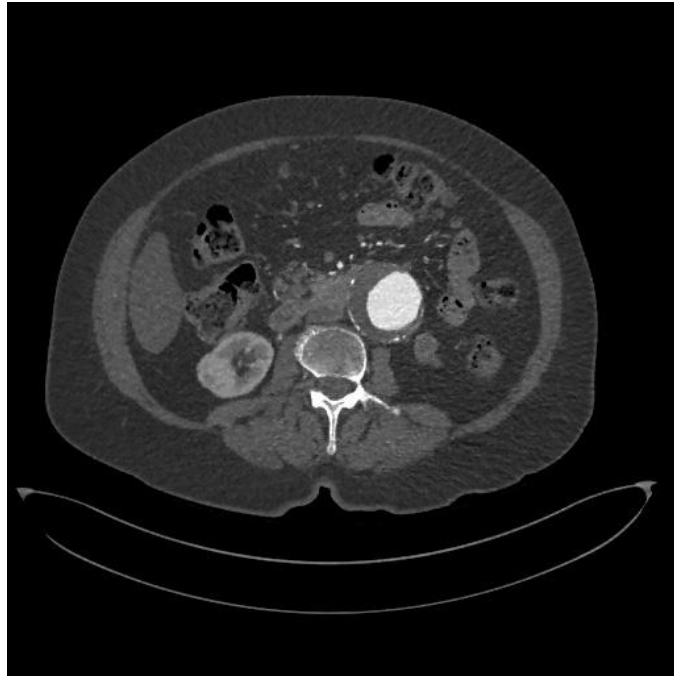
Slika 4. Prikaz AAA korištenjem CT-angiografije.