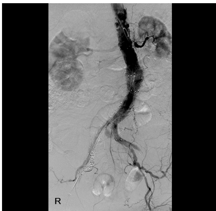
Slika 7. DSA tijekom EVAR-a.

Pacijentu se daje bolus od 0.5 do 1 ml/kg metilglukamin diatrizoata kroz perifernu venu brzinom od 15 do 20 ml/s. U prosjeku to je oko 40 ml bolusa nakon kojeg se daje 25 ml dekstroze za čišćenje vene. Nakon injekcije snimaju se radiološke slike 1 do 3 puta u sekundi i snimanje traje ukupno 15 sekundi (30).