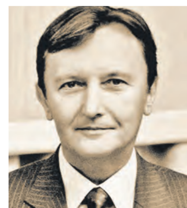
Davor Miličić 2009./15.