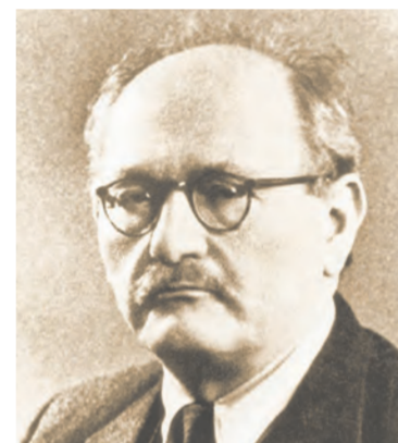
Andrija Štampar 1940./41. i 1952./57.