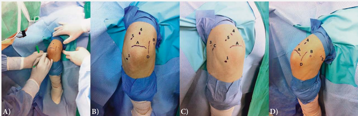
SLIKA 1. BOLESNIK U POLOŽAJU NA TRBUHU U OPĆOJ ANESTEZIJI S LIJEVOM RUKOM U DRŽAČU TAKO DA RUKA VISI PREKO RUBA OPERACIJSKOG STOLA: A) NAKON KIRURŠKOG PRANJA OPERACIJSKOG POLJA I STERILNOG POKRIVANJA OPERATER IDENTIFICIRA TE STERILNIM FLOMASTEROM OZNAČAVA NA LAKTU KOŠTANE ORIJENTIRE (VRH OLEKRANONA, LATERALNI I MEDIJALNI EPIKONDIL HUMERUSA) TE TIJEK ULNARNOG ŽIVCA NA OSNOVI KOJIH OZNAČAVA PREDMNIJEVANA MJESTA ZA OSNOVNIH PET ARTROSKOPSKIH ULAZA; B) OZNAČENI SU A – VRH OLEKRANONA, B – MEDIJALNI EPIKONDIL, D – TIJEK ULNARNOG ŽIVCA, KAO I PREDMNIJEVANI ULAZI 1 – DIREKTAN LATERALNI ULAZ, 4 – DIREKTAN STRAŽNJI ULAZ TE 5 – POSTEROLATERALNI ULAZ; C) OZNAČENI SU A – VRH OLEKRANONA, C – LATERALNI EPIKONDIL, KAO I PREDMNIJEVANI ULAZI 1 – DIREKTAN LATERALNI ULAZ, 3 – PROKSIMALNI ANTEROLATERALNI ULAZ, 4 – DIREKTAN STRAŽNJI ULAZ TE 5 – POSTEROLATERALNI ULAZ; D) OZNAČENI SU A – VRH OLEKRANONA, B – MEDIJALNI EPIKONDIL, D – TIJEK ULNARNOG ŽIVCA, KAO I PREDMNIJEVANI ULAZI 2 – PROKSIMALNI ANTEROMEDIJALNI ULAZ I 4 – DIREKTAN STRAŽNJI ULAZ.

FIGURE 1. PATIENT, DURING GENERAL ANAESTHESIA, IN A PRONE POSITION WITH HIS LEFT HAND IN A HOLDER HANGING OVER THE EDGE OF AN OPERATING TABLE: A) FOLLOWING SURGICAL PREPPING AND DRAPING, SURGEON IDENTIFIES AND MARKS BONY LANDMARKS WITH A STERILE MARKER (TIP OF THE OLECRANON, LATERAL AND MEDIAL HUMERAL EPICONDYLE) AS WELL AS ULNAR NERVE COURSE WHICH SERVES AS A BASIS FOR MARKING FIVE STANDARD ARTHROSCOPIC PORTALS OF THE ELBOW; B) MARKED AS FOLLOWING A – TIP OF THE OLECRANON, B – MEDIAL EPICONDYLE, D – ULNAR NERVE COURSE, AS WELL AS 1 – DIRECT LATERAL PORTAL, 4 – DIRECT POSTERIOR PORTAL AND 5 – POSTEROLATERAL PORTAL; C) MARKED AS FOLLOWING A – TIP OF THE OLECRANON, C – LATERAL EPICONDYLE, AS WELL AS 1 – DIRECT LATERAL PORTAL, 3 – PROXIMAL ANTEROLATERAL PORTAL, 4 – DIRECT POSTERIOR PORTAL AND 5 – POSTEROLATERAL PORTAL; D) MARKED AS FOLLOWING A – TIP OF THE OLECRANON, B – MEDIAL EPICONDYLE, D – ULNAR NERVE COURSE, AS WELL AS 2 – PROXIMAL ANTEROMEDIAL PORTAL AND 4 – DIRECT POSTERIOR PORTAL.