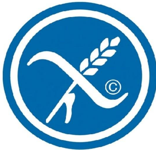
Slika 1: Prekriženi klas pšenice