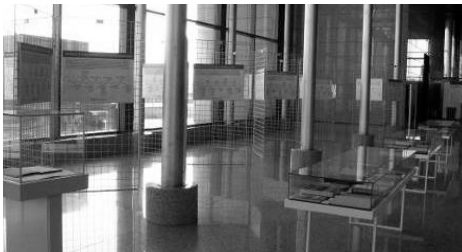
Slika 3. Prikaz dijela postava s izložbenim plakatima na izložbi „Knjige pričaju o 100 godina Medicinskog fakulteta“ otvorenoj u Nacionalnoj i sveučilišnoj knjižnici u Zagrebu 14. prosinca 2017. godine

Pri osmišljavanju plakatnih prikaza i izradi njihova tekstualnog sadržaja (tzv. interpretacijskih legendi) posebna se pozornost posvetila stvaranju vizualnog identiteta izložbe i njegova ujednačenog korištenja u svim izložbenim cjelinama. Pisanje stručnog sadržaja planiranog za izlaganje na izložbi iznimno je kompleksan proces koji uključuje pomno istraživanje kako bi se osigurala znanstvena točnost, autentičnost i utemeljenost u dostupnoj literaturi, a prilikom kojeg se mora voditi računa i o njegovu prilagođavanju potencijalnoj publici. Pratile su se smjernice za izradu tekstualnih elemenata izložbi, 43 te su se tekstovi oblikovali kao kratke bilješke, tj. kratke priče, a birane su činjenice koje bi mogle biti zanimljive i publici koja nije usko specijalizirana u predstavljenoj temi te se na umu imala i uporaba leksika u kojem se izbjegavala stručna terminologija. Tekst na plakatima bio je logički i intuitivno organiziran, kombinirao se sa slikovnim sadržajem radi veće atraktivnosti, a težilo se tomu da se fizičkim izlošcima na izložbi, tj. knjigama, pruži odgovarajući kontekst i interpretaciju koja će posjetitelje potaknuti na interakciju s izložbom. Vizualni identitet izložbe ostvaren je uporabom jedne tipografije za sav tekstualni materijal (izložbene legende, popratni izložbeni materijali: katalog izložbe, pozivnice) te ujednačenih grafičkih rješenja plakata koji su predstavljali katedre (npr. uporaba vremenske lente), uz zasebna rješenja za uvodni i završni plakat.