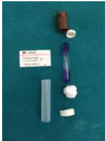
Slika 12-Sadržaj ampule brzog indikatora

Indikator se sastoji od staklene ampule ispunjene hranjivom podlogom ispod koje je papirna traka koja sadrži 10^6 bakterijskih spora. Sve zajedno je smješteno u plastičnu košuljicu koja na poklopcu ima filtarski papir kako bi para mogla prodrijeti do spora (Slika 12).