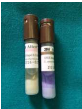
Slika 1511-Pozitivna i negativna ampula brzog indikatora

Čitanje rezultata nakon 3 sata omogućuje nam da kratko zadržimo materijal koji je bio izložen procesu sterilizacije dok ne dobijemo potvrdu o ispravnosti ciklusa. Zbog toga se sve više koriste.