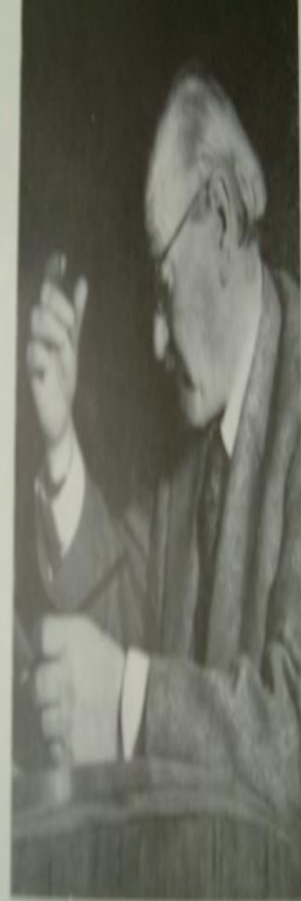
Štampar u radu