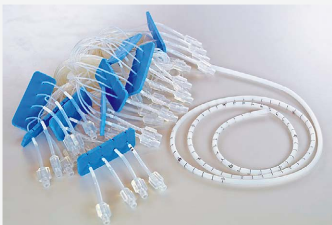
SLIKA 2A. PRIKAZ VODOM-PERFUNDIRANOG KATETERA

FIGURE 2A. WATER-PERFUSED CATHETER