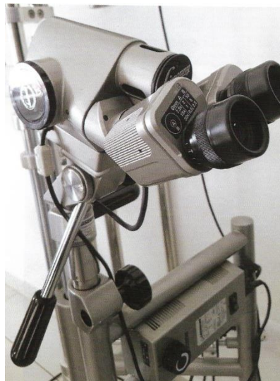
Slika 1. Suvremeni kolposkop: binokularna glava, vijci za odabir povećanja, ručka za pomjeranje glave kolposkopa.

Kolposkopija je medicinski postupak kojim se pod uvećanjem i osvjetljenjem pregledava cerviks, vagina i vulva. Mnoge premaligne i maligne lezije imaju određene karakteristike koje se mogu vidjeti takvim pregledom. Obavlja se pomoću kolposkopa koji pruža uvećani pogled na ta područja te omogućuje kvalificiranom liječniku razlikovati uredan od abnormalnog nalaza.