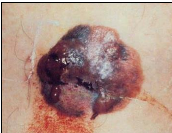
Slika 3. Nodularni melanom [17]