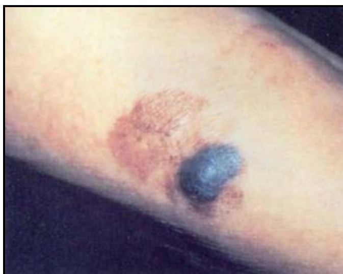
Slika 4. Lentigo maligni melanom [17]

Lentigo maligni melanom (LMM - od engl. Lentigo Maligna Melanoma) čini 4 do 15% kožnih melanoma i, za razliku od nodularnog i površinskoširećeg melanoma, pojavnost mu korelira s dugotrajnim izlaganjem suncu i povećanjem dobi. Njegova je značajka produljena radijalna faza rasta u obliku lentigo maligna (LM), spororastuće pigmentirane tvorbe na osunčanim dijelovima tijela, najčešće vratu i licu, nakon čega nastupa prijelaz u vertikalnu fazu rasta, kad se naziva lentigo malignim melanomom . Klinički se obično prezentira kao crna ili smeđa papula [7,17] (Slika 4).