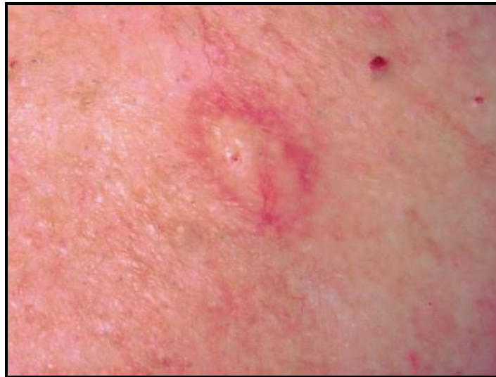
Slika 6. Dezoplastični melanom [20]

Primarni melanom sluznice smatra se odvojenim entitetom od primarnog melanoma kože. Iako čini mali udio ukupnog broja melanoma, gotovo polovica novodijagnosticiranih slučajeva melanoma sluznica javlja se u području glave i vrata. Najčešća lokalizacija je nosna šupljina, osobito prednji dio nosne pregrade [19]. Pravovremena dijagnoza otežana je zbog rijetkosti samog tumora, često okultnog sjela tumora i činjenicom da je gotovo polovica melanoma sluznice amelanotična [21].