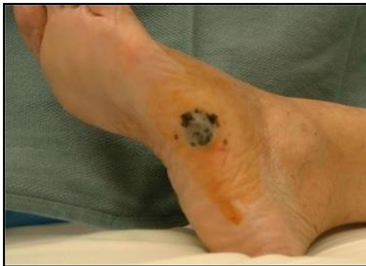
Slika 5. Akralni lentiginozni melanom [18]

Akralni lentiginozni melanom (ALL - od engl. Acral Lentiginous Melanoma) čini samo 5% melanoma u bijelaca, a najčešći je tip melanoma u osoba tamnije puti, afričkog i azijskog podrijetla. Najčešće je lokaliziran na dijelovima kože bez dlaka - dlanovima, tabanima, prstima i ispod noktiju, a češći je u starijih osoba ženskog spola [7,17]. Klinički se obično prezentira kao makula ili papula nepravilnog ruba i nehomogenog pigmenta. Dijagnoza se obično postavlja kasno jer se tumor često pogrešno procijeni kao traumatska rana, bradavica, gljivična infekcija ili piogeni granulom [18] (Slika 5).