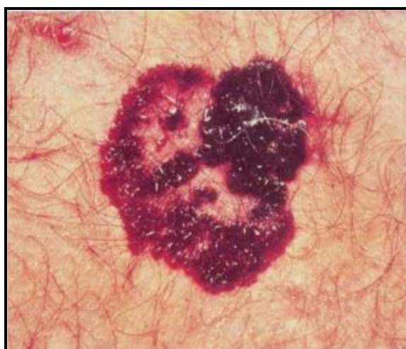
Slika 2. Površinskošireći melanom s vidljivim središnjim područjem regresije [17]

Površinskošireći melanom (SSM - od engl. Superficial Spreading Melanoma) najčešći je tip melanoma na koji otpada oko 70% novodijagnosticiranih slučajeva. Najčešće je lokaliziran na donjim ekstremitetima u žena, odnosno na leđima u muškaraca, kao oštro ograničena palpabilna kvržica koja se proteže nekoliko milimetara iznad površine kože. Bojom su izrazito varijabilni, a centralna područja regresije relativno su često prisutna. Njegova je osobitost radijalna faza rasta s kasnijim vertikalnim širenjem, na što ukazuje pojava difuzne induracije [7,17] (Slika 2).