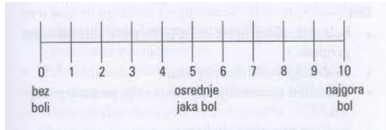
Slika 10. Skala za određivanje jačine boli

u predjelu leđa i na trtici, a ona nastaje kao posljedica dugotrajnog ležanja u operacijskoj sali te obično nestaje nakon operacije kada se par puta promjeni položaj u krevetu. Bolesnici se najčešće tuže na bol nakon prestanka djelovanja anestetika. Bol je često praćena autonomnim živčanim reakcijama kao što su ubrzan puls, tlak, disanje, proširene zjenice i mišićna napetost. Zadaće medicinske sestre u otklanjanju boli su prikupljanje podataka vezanih uz lokalizaciju, trajanje i karakter boli. Zatim slijedi procjena boli na skali za određivanje jačine boli.