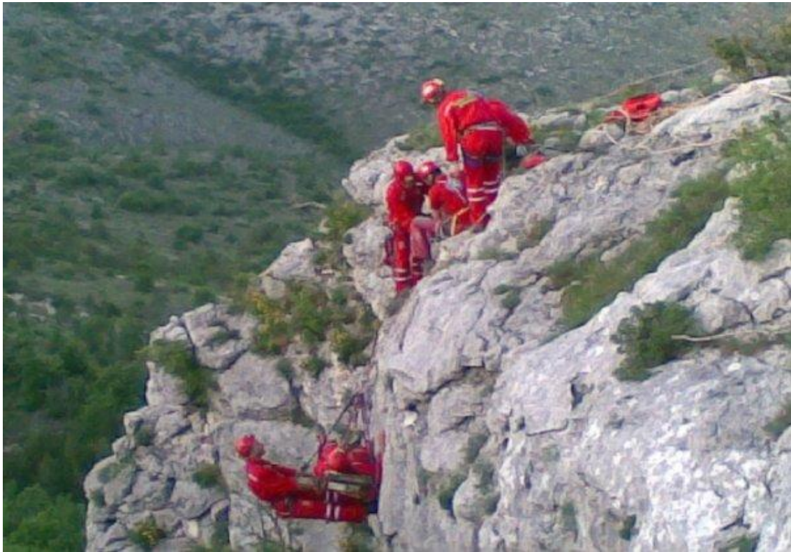
Slika 5: Članovi HGSS-a u akciji spašavanja iz stijene mariner nosilima