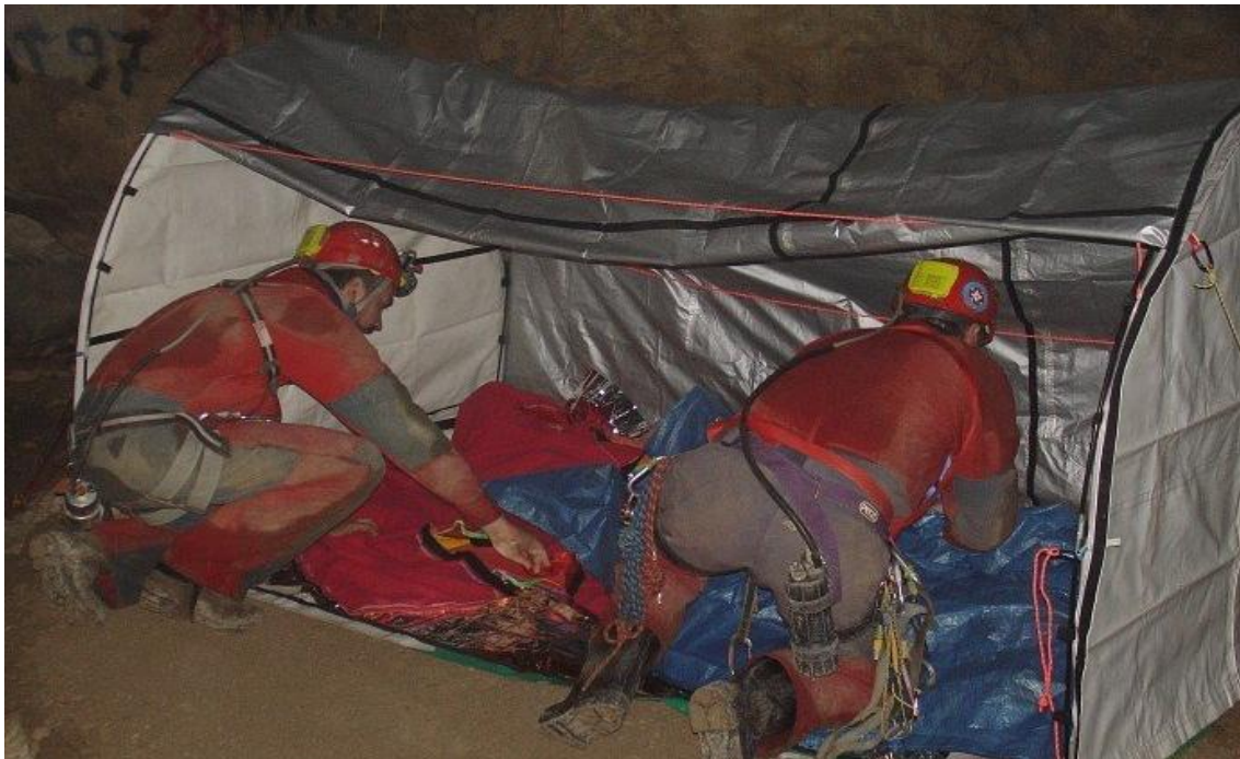
Slika 6: Spašavatelji pripremaju bivak za unesrećenoga

Za izvlačenje unesrećenika najprikladnijim se pokazalo podizanje sustavom protuutega. U takvom radu unesrećeni i nosila idu zasebno bez pratitelja-liječnika koji se penje samostalno po drugom užetu i pomaže nosilima. Važno je da ekipa za transport bude uigrana jer je izvlačenje unesrećenika često najkritičniji dio akcije. Također treba imati na umu da nakon izlaska iz speleološkog objekta unesrećenom još predstoji transport i vani, helikopterski ili terestrijalni, te ga za isti treba posebno pripremiti (Đonlagić, Stopar 2014).