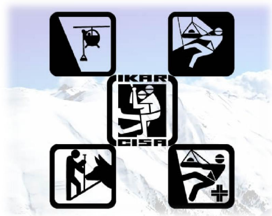
Slika 2: Znak udruge IKAR-CISA i stručnih komisija

Znak HGSS-a ima oblik kruga u kojem se na bijelom polju nalazi crveni križ sa stiliziranim runolistom u sredini, okružen plavim prstenom unutar kojeg je zlatnim slovima ispisano "Hrvatska gorska služba spašavanja" (Statut Hrvatske gorske službe spašavanja 2006).