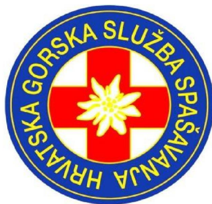
Slika 3: Oznaka Hrvatske gorske službe spašavanja

Znak HGSS-a ima oblik kruga u kojem se na bijelom polju nalazi crveni križ sa stiliziranim runolistom u sredini, okružen plavim prstenom unutar kojeg je zlatnim slovima ispisano "Hrvatska gorska služba spašavanja" (Statut Hrvatske gorske službe spašavanja 2006).