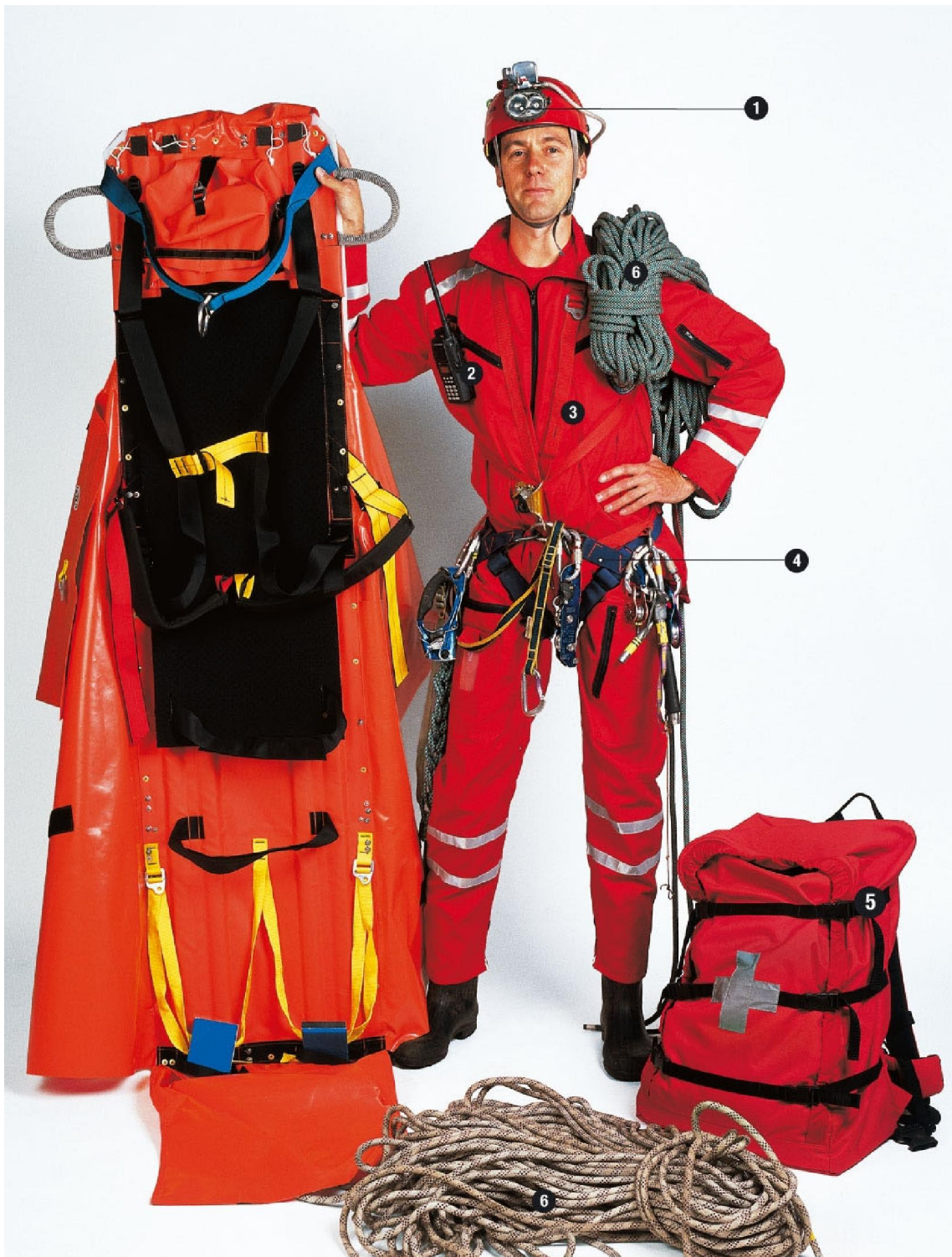
Slika 4: Osnovna spasilačka oprema