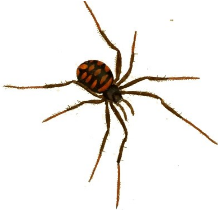
Slika 3. Prikaz mediteranske crne udovice, objavljen u Koch CL. Die Arachniden. Dritter Band. C. H. Zeh'sche Buchhandlung, Nürnberg; 1816. Knjiga dostupna na https://wsc.nmbe.ch . Grafički obradio autor diplomskog rada.

Mediteranska crna udovica na području Republike Hrvatske obitava na područjima Istre, Hrvatskog primorja i Dalmacije; zatim ju se može naći u Hercegovini, Crnoj Gori, Makedoniji, u širem mediteranskom području i južnoj Rusiji (2). Bez obzira na svoje latinsko ime (koje u doslovnom prijevodu znači “potajni ugrizač” ili “onaj koji grize plaćenika”, ovisno gledaju li se starogrčki ili latinski korijeni riječi), pauk je međunarodno poznat kao crna udovica; ime je dobio po tome što ženke prakticiraju tzv. seksualni kanibalizam, odnosno jedu mužjake nakon parenja, što se u životinjskom svijetu klasično objašnjava time da na taj način ženke povećavaju šanse za preživljenje svojih potomaka. Međutim, određeni su autori (6) došli do zaključka