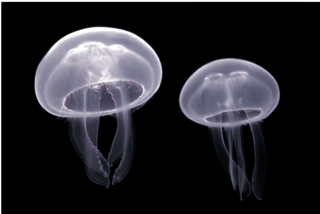
Slika 6. Uhati klobuk (lat. Aurelia aurita ) Autor: Luc Viatour [slika s interneta]. 2010 May 23 [pristupljeno 13 June 2020]. CC BY-SA 3.0 https://creativecommons.org/licenses/by-sa/3.0/legalcode Dostupno na: https://commons.wikimedia.org/wiki/File:Aurelia_aurita_(Cnidaria)_Luc_Viatour.jpg

U Jadranskom moru živi nekoliko vrsta meduza od kojih su najpoznatije uhati klobuk (lat. Aurelia aurita ) i morska mjesečina (lat. Pelagia noctiluca ). (10) Građene su pretežno od vode te izgledom podsjećaju na zvono ili kišobran. Nemaju dobru kontrolu vlastitog kretanja pa ih lako nose morske struje zbog čega plutaju. Meduze posjeduju duge lovke sa žarnim stanicama koje luče otrovni sadržaj. Koriste ih za lov, ali i za obranu. Aktiviraju se na dodir, prilikom čega dolazi do izbacivanja žarne niti koja ubada tkivo koje ju je dodirnulo i u njega prenosi otrov. (2)