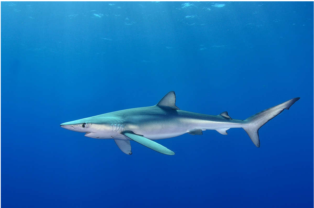
Slika 2. Morski pas modrulj (lat. Prionace glauca)

mekuš (lat. Mustelus punctulatus ), kostelj (lat. Squalus acanthias ) te kučak (lat. Isurus oxyrinchus ). Ostale vrste rijetko se susreću u Jadranskom moru. (10) Ukupna populacija morskih pasa je ugrožena zbog pretjeranog izlova, a u prilog tome ide i njihov dugotrajan rast, kasno spolno sazrijevanje, dugo vrijeme gestacije i mali broj potomaka. (2) Uglavnom ih love zbog peraja, koje su vrlo cijenjene u azijskoj kulturi. (11)