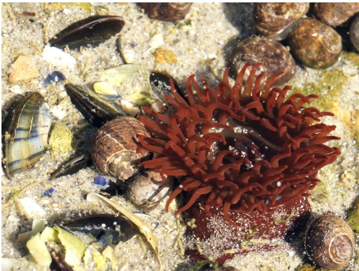
Slika 9. Crvena moruzgva (lat. Actinia equina ) Autor: Hans Hillewaert [slika s interneta]. 2008 May 3 [pristupljeno 13 June 2020]. CC BY-SA 4.0 https://creativecommons.org/licenses/by-sa/4.0/legalcode Dostupno na: https://commons.wikimedia.org/wiki/File:Actinia_equina_(Boulogne-sur-Mer).jpg