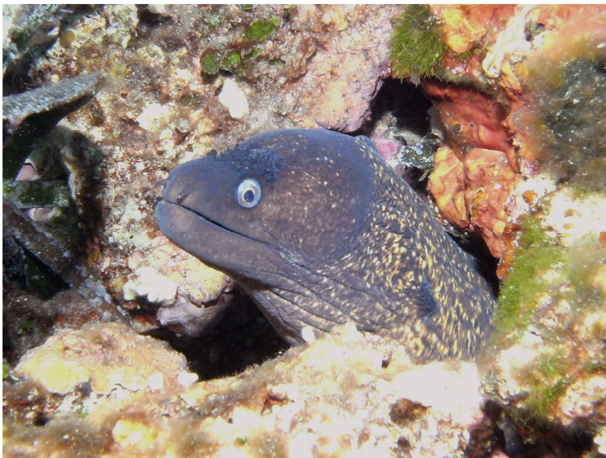
Slika 1. Murina žutošarka (lat. Muraena helena) [slika s interneta]. 2009 August 10 [pristupljeno 13.6.2020.]. CC BY-SA 3.0 https://creativecommons.org/licenses/by-sa/3.0/legalcode Dostupno na: https://commons.wikimedia.org/wiki/File:Murenahelena.jpg