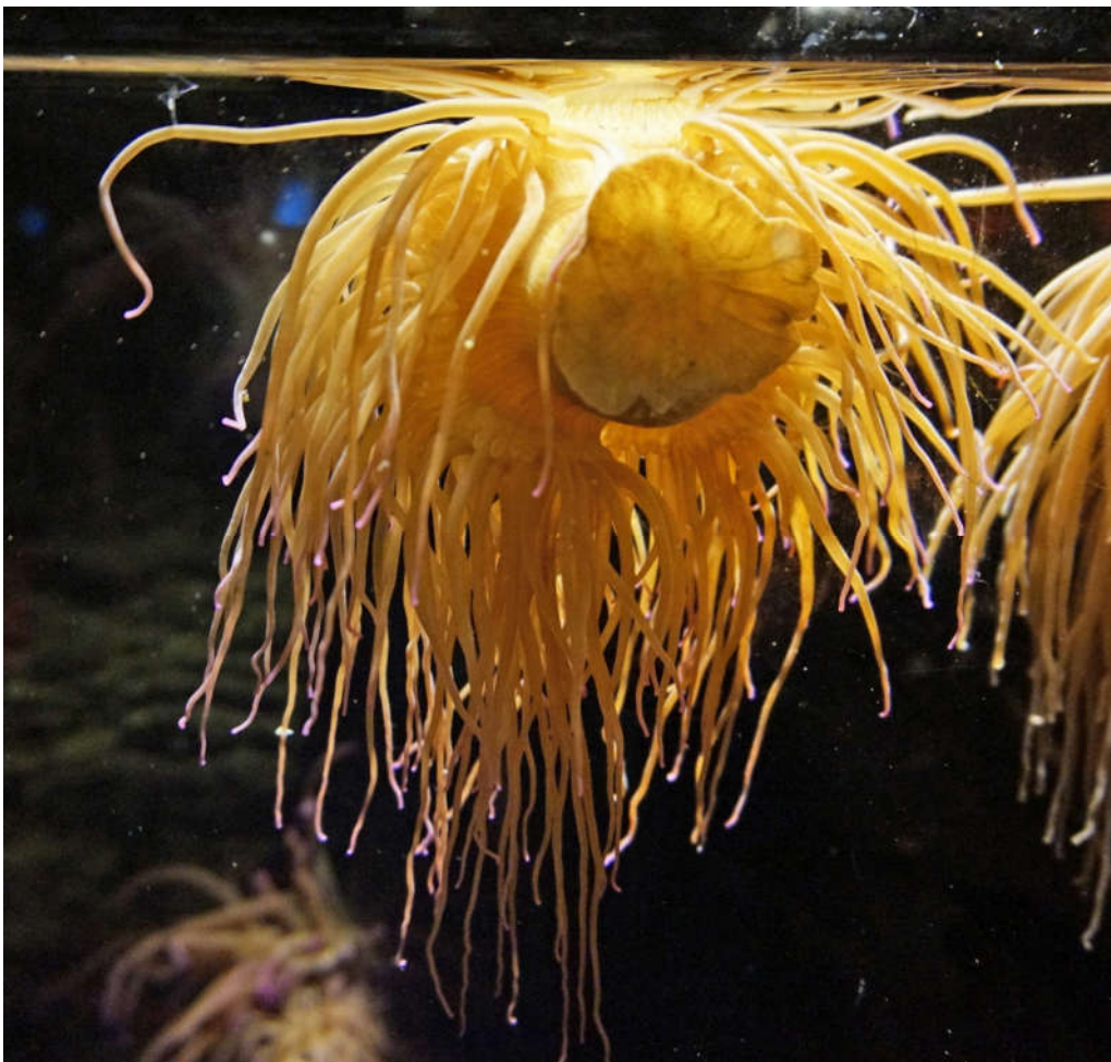
Slika 8. Smeđa vlasulja (lat. Anemonia viridis ) Autor: Tiia Monto [slika s interneta]. 2015 May 18 [pristupljeno 13 June 2020]. CC BY-SA 3.0 https://creativecommons.org/licenses/by-sa/3.0/legalcode Dostupno na: https://commons.wikimedia.org/wiki/File:Anemonia_viridis.jpg

Iako nalikuju morskom bilju, to su životinje koje također spadaju u red žarnjaka (lat. Cnidaria ). (21) Žive u pojasu plime i oseke, pričvršćene na morsko dno te posjeduju lovke kojima hvataju plijen. U Jadranu se najčešće susreću smeđa vlasulja (lat. Anemonia viridis ) i crvena moruzgva (lat. Actinia equina ). (10) S obzirom na sedentarni način života vlasulja, gotovo uvijek stradavaju kupaći prilikom neopreznog ulaska u more. Klinička slika i postupak liječenja jednaki su kao i u slučaju uboda meduze.(2)