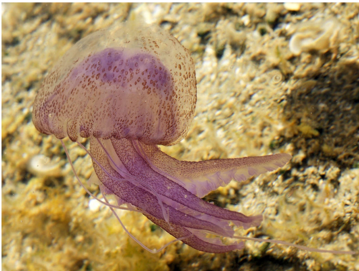
Slika 7. Morska mjesečina (lat. Pelagia noctiluca ) Autor: Hans Hillewaert [slika s interneta]. 2008 April 28 [pristupljeno 13 June 2020]. CC BY-SA 4.0 https://creativecommons.org/licenses/by-sa/4.0/legalcode Dostupno na: https://commons.wikimedia.org/wiki/File:Pelagia_noctiluca_(Sardinia).jpg