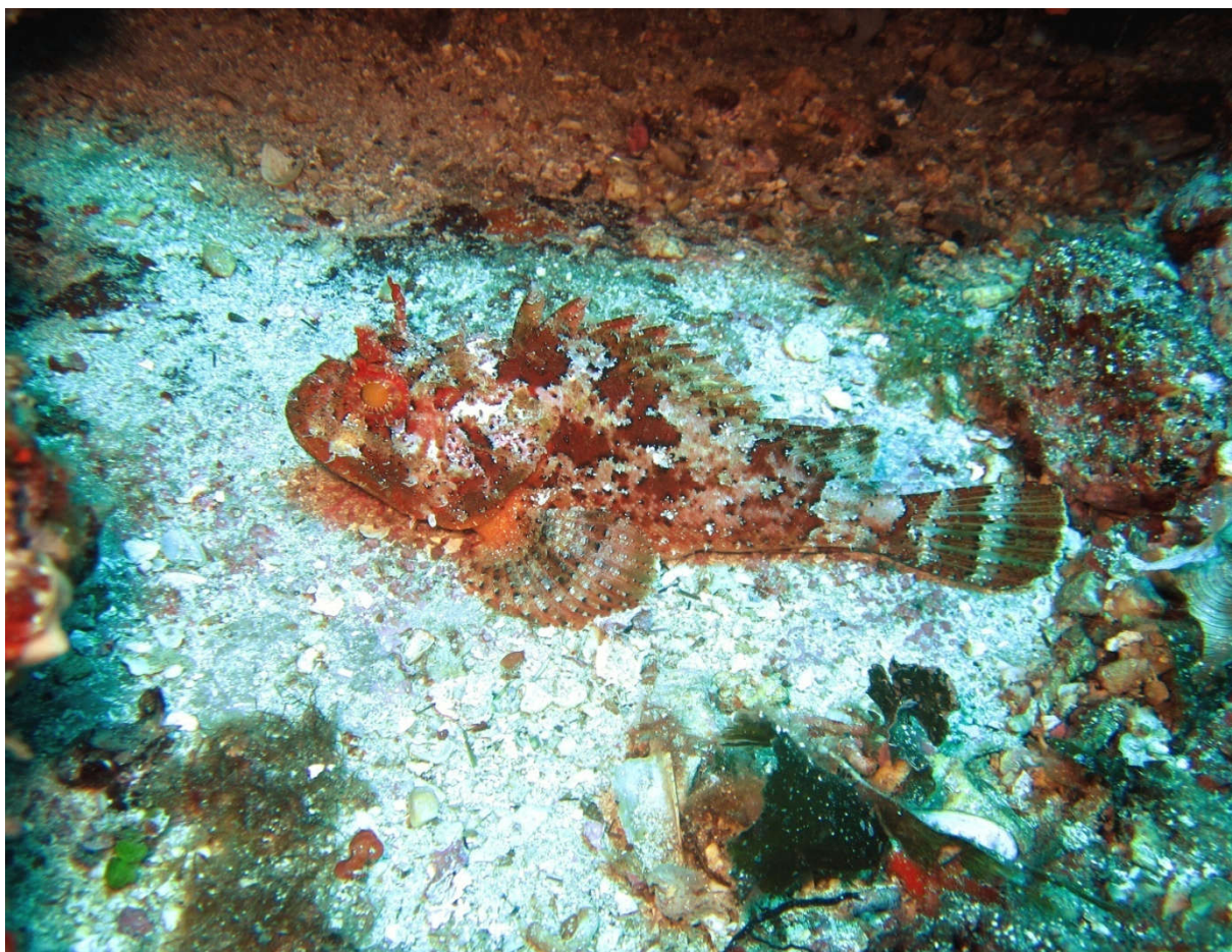
Slika 4. Škarpina (lat. Scorpaena scrofa ) Autor: Alessandro Massa [slika s interneta]. 2017 September 5 [pristupljeno 13 June 2020]. CC BY-SA 4.0 https://creativecommons.org/licenses/by-sa/4.0/legalcode Dostupno na: https://commons.wikimedia.org/wiki/File:Scorpaena_scrofa_Capo_Figari_2.jpg