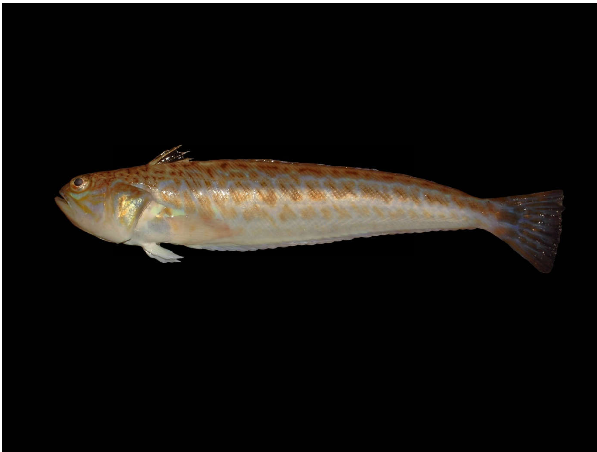
Slika 3. Pauk bijelac (lat. Trachinus draco ) Autor: Hans Hillewaert [slika s interneta]. 2005 October 20 [pristupljeno 13 June 2020]. CC BY-SA 4.0 https://creativecommons.org/licenses/by-sa/4.0/legalcode Dostupno na: https://commons.wikimedia.org/wiki/File:Trachinus_draco.jpg