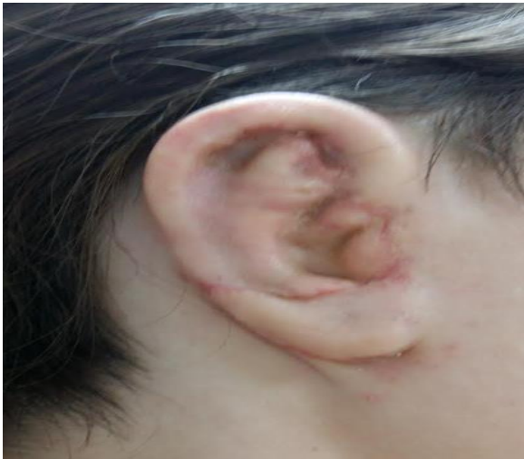
Slika 5. Izgled rekonstruirane uške (dozvolom doc. dr. sc. Ivana Rašića)

Pristup sekundarnoj rekonstrukciji uha započinje se procjenom retroaurikularne kože. Unatoč prethodnoj disekciji, kožna ovojnica nakon prve faze rekonstrukcije zadržava dovoljno elastičnosti i prokrvljenosti da bi se iskoristila za prekrivanje novog hrskavičnog okvira. Sekundarna rekonstrukcija nakon druge faze izazovnije je pothvat, gdje je koža često neupotrebljiva i moraju se razmotriti alternativne mogućnosti pokrivanja kao što su neizravno širenje tkiva i lokalni fascijalni režnjevi.(5)