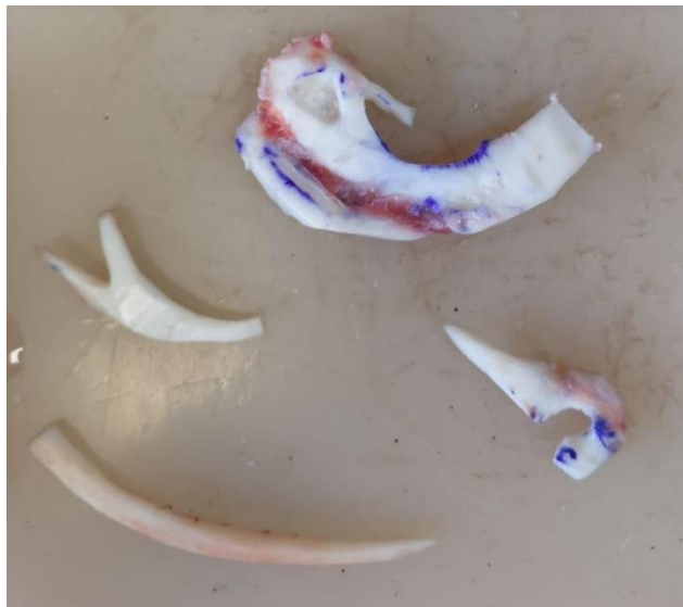
Slika 2. Oblikovani dijelovi rebrene hrskavice potrebni za izradu hrskavičnog okvira

Nakon toga, krakovi heliksa se produžuju sa prednjeg dijela heliksa i pričvršćuju na stražnju površinu središnjeg dijela anheliksa u zakrivljenom obliku. (16) (17)