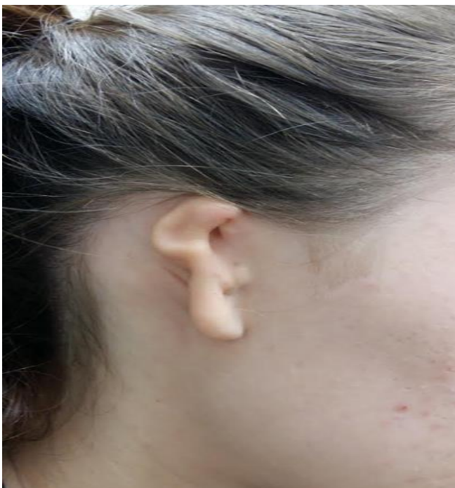
Slika 1. Izgled mikrotične uške prije rekonstrukcije

Mikrotija je kongenitalna malformacija vanjskog i srednjeg uha uzrokovana abnormalnim razvojem prvog i drugog škržnog luka te prve škržne brazde u embrionalnom razvoju. Može biti jednostrana ili obostrana, a stupanj deformiteta ušiju može se kretati od blagih abnormalnosti do potpune odsutnosti uha. Obično je praćena sa ipsilateralnim gubitkom sluha, a moguća je i mandibularna te facijalna displazija. (4)