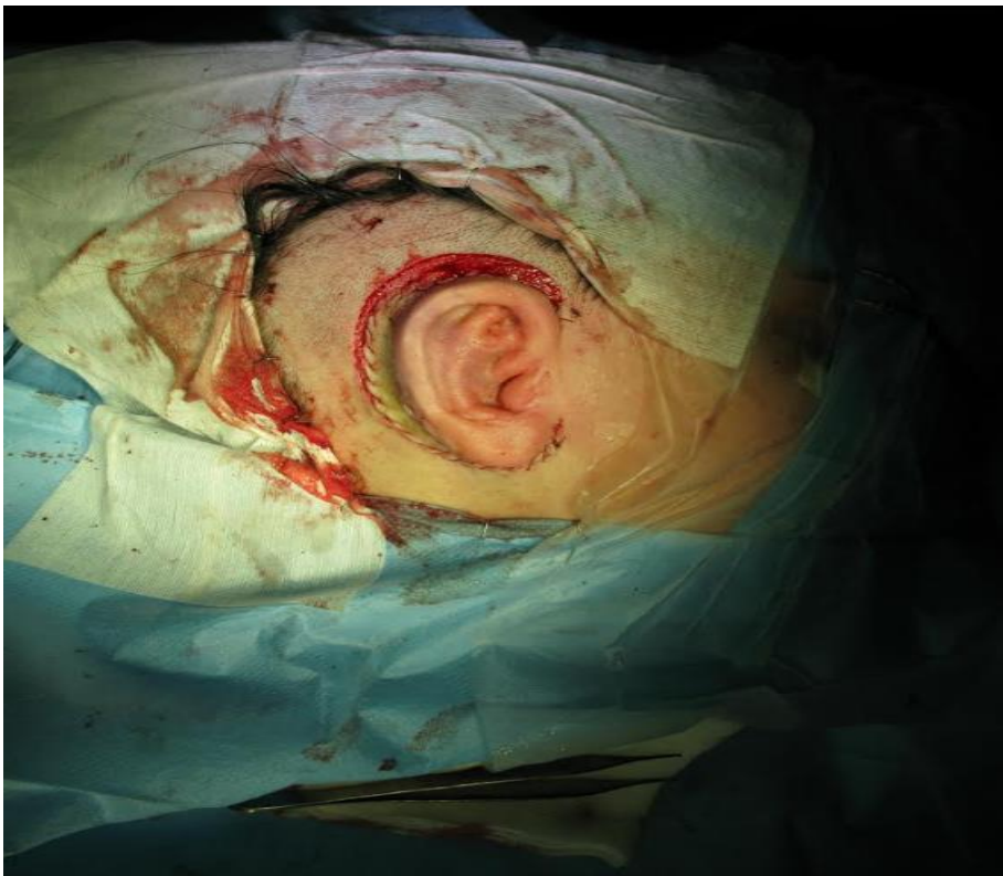
Slika 4. Prikaz druge faze: operacija podizanja uha

Druga faza autologne rekonstrukcije je kompleksni zahvat podizanja ušiju u pravilan položaj. Operacija se izvodi šest mjeseci nakon izrade i umetanja trodimenzionalnog hrskavičnog okvira. Šesta rebrena hrskavica se uklanja s kože gdje je bila smještena te se rezbari u oblik polumjeseca, s tim da stražnji dio mora biti širok oko 1 cm te se zatim pričvršćuje za stražnju površinu konstruirane uške i za površinu mastoida s 4-0 najlonskim šavom. Preko tako fiksirane hrskavice se stavlja režanj temporoparijetalne fascije koji prolazi kroz potkožni tunel. Na samom kraju operacije graft kože pune debljine, uzet iz područja prepona, stavlja se kao završni sloj na uho. Koža koja pokriva prednju površinu okvira, trodimenzionalni hrskavični okvir i graft kože sa stražnje površine uške se šivaju zajedno jer tako dodatno zatežu i održavaju konturu kože konstruiranog uha. (13)