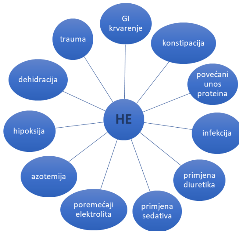
Slika 2. Čimbenici koji precipitiraju hepatalnu encefalopatiju modificirano prema: Häussinger, Schliess (2008), Pathogenic mechanisms of hepatic encephalopathy.

Poznato je da se HE često javlja kada se pojavi neki čimbenik koji do tada u bolesti nije bio prisutan (Mas, 2006). Takav precipitirajući čimbenik može potaknuti napredovanje jetrene bolesti te pojavu novih neurokognitivnih simptoma i znakova, što označava razvoj HE. Mnogo je načina na koji precipitirajući faktori djeluju, a svi oni iniciraju kaskadu patofizioloških mehanizama koja naposljetku vodi do disfunkcije astrocita i neurona te indukcije oksidativnog stresa (Ochoa-Sanchez i sur, 2018). Najčešći čimbenici koji precipitiraju HE navedeni su na slici 2.