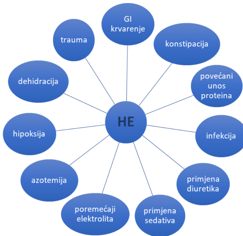
Slika 2. Čimbenici koji precipitiraju hepatalnu encefalopatiju modificirano prema: Häussinger, Schliess (2008), Pathogenic mechanisms of hepatic encephalopathy.

Poznato je da se HE često javlja kada se pojavi neki čimbenik koji do tada u bolesti nije bio prisutan (Mas, 2006). Takav precipitirajući čimbenik može potaknuti napredovanje jetrene bolesti te pojavu novih neurokognitivnih simptoma i znakova, što označava razvoj HE. Mnogo je načina na koji precipitirajući faktori djeluju, a svi oni iniciraju kaskadu patofizioloških mehanizama koja naposljetku vodi do disfunkcije astrocita i neurona te indukcije oksidativnog stresa (Ochoa-Sanchez i sur, 2018). Najčešći čimbenici koji precipitiraju HE navedeni su na slici 2.