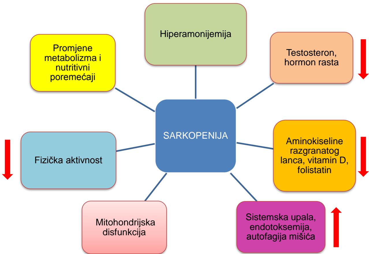
Slika 3. Potencijalni patogenetski mehanizmi sarkopenije u kroničnim bolestima jetre, modificirano prema Bunchorntavakul C i Reddy KR. Review article: malnutrition/sarcopenia and frailty in patients with cirrhosis. Aliment Pharmacol Ther. 2019;00:1–14.