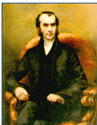
Slika 1. Thomas Hodgkin (1798.-1866.)

Hodgkinov limfom hematološka je neoplazma koja nastaje u limfnim čvorovima. Morfološki je bolest karakterizirana Reed-Sternbergovim (RS) stanicama okruženim s obiljem upalnog infiltrata. Za podrijetlo RS dugo se nije znalo, ali danas se zna da tumorske stanice potječu od B limfocita (1). Hodgkinov limfom prvi put je opisan 1832. godine. Opisao ga je Thomas Hodgkin, po kojem je bolest kasnije i dobila naziv. Prilikom obdukcije sedam pacijenata uočio je povećane limfne čvorove i slezenu bez znakova tuberkuloze, upale ili neoplazme (2).