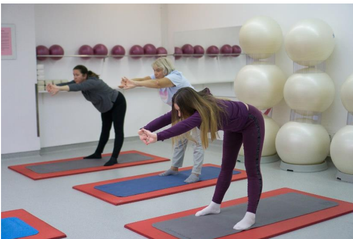
Slika 17. Katichakrasana

Početni položaj je u malo većem raskoraku. Prsti ruku se isprepletu te se potom udišući podignu ruke iznad glave. Izdišući se savije gornji dio tijela prema naprijed, ruke ostaju ispružene prema naprijed, tako da leđa i ruke budu usporedni s podom. Udišući, okreće se gornji dio tijela u jednu stranu i izdišući vraća u sredinu. Vježba se ponovi u drugu stranu. Udišući se ponovo uspravimo i vratimo ruke u početni položaj. Vježba se ponovi nekoliko puta.