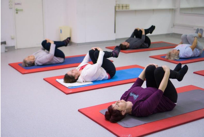
Slika 7. Bočno kotrljanje

Noge se saviju, rukama se obuhvate koljena i privuku tijelu. Izdišući se kotrlja u jednu, pa potom u drugu stranu.