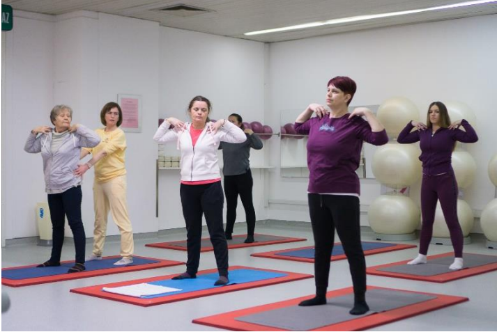
Slika 16. Uvrtnanje gornjeg dijela tijela

Stane se u mali raskorak. Prsti se isprepletu iza glave. Izdišući se okrene gornji dio tijela u jednu stranu, a udišući vraća u sredinu. Vježba se ponovi na drugu stranu.