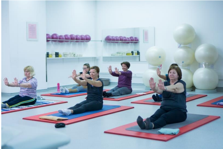
Slika 11. Vježbe za ruke i šake

Sjedi se ispruženih nogu. Leđa su uspravna i opuštena. Ispružene ruke se podignu ispred trupa te potom radi niz vježbi za jačanje i razgibavanje šaka i ručnih zglobova.