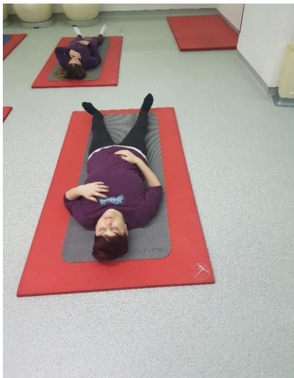
Slika 3. Vježba potpunog jogijskog disanja

Dlan jedne ruke se stavi na trbuh, a drugi na prsni koš. Potrebno je primijetiti kako se kod udisaja najprije polako podiže trbuh te potom prsni koš, a u izdisaju pokreti su suprotni. Pratimo kako disanje postaje sve sporije kako se tijelo opušta.