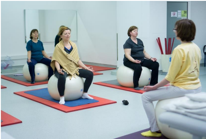
Slika 22. Meditacija