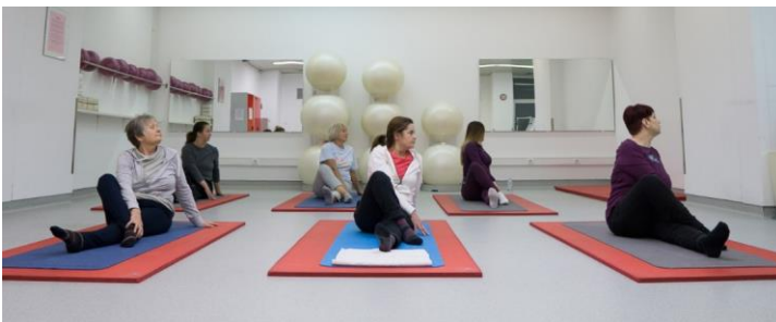
Slika 13. Meru Vakrasana

Ruke su na podu iza tijela. Udišući stavi se lijevi dlan na pod s desne strane zdjelice. Izdišući savije se lijeva noga u koljenu i stopalo spusti s vanjske strane desne natkoljenice. Udahom se gornji dio tijela i glava ispruže prema gore, a potom sa izdahom rotiraju u desno. Zadrži se u položaju normalno dišući nekoliko trenutaka, a potom izdišući vrati u početni položaj. Vježba se potom ponovi i na drugu stranu.