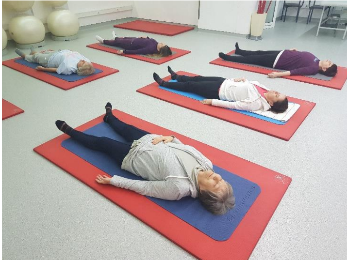
Slika 2. Vježba trbušnog disanja