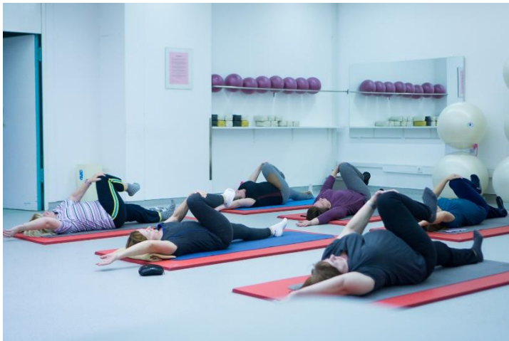
Slika 4. Uvrtnanje u ležećem položaju

Savije se koljeno te se stopalo iste noge stavi na suprotnu natkoljenicu. Suprotnom rukom se koljeno uhvati s vanjske strane te potom izdišući pritisne do poda. Glava se istodobno okreće u suprotnu stranu.