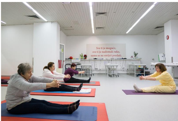
Slika 10. Mljevenje

Ruke se ispruže prema naprijed isprepletenih prstiju. Gornjim dijelom tijela i rukama se rade široki krugovi usporedni s podom. Kod savijanja trupa prema naprijed se izdiše, kod naginjanja prema natrag se udiše.