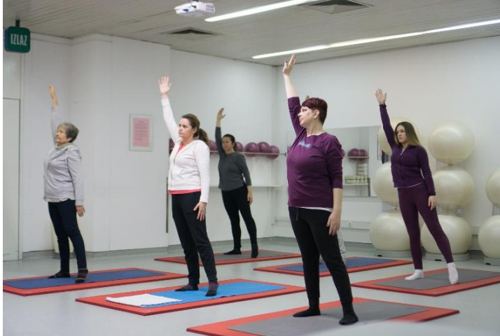
Slika 14. Prebacivanje težine tijela

Ruke su savijene u laktovima, šake na bokovima. Udišući se savije koljeno desne noge te se težina tijela prebaci na tu nogu i lagano pritisne u pod, dok lijeva noga bude potpuno rasterećena. Udišući se vraća u početni položaj i ponovi vježba na drugu stranu.