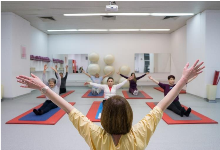
Slika 12. Križanje ruku

Leđa su uspravna. Udišući ruke se ispružene podignu u stranu u visinu ramena, a potom prekriže iznad glave. Izdišući se ispružene ruke ponovo spuštaju na pod sa strane tijela.