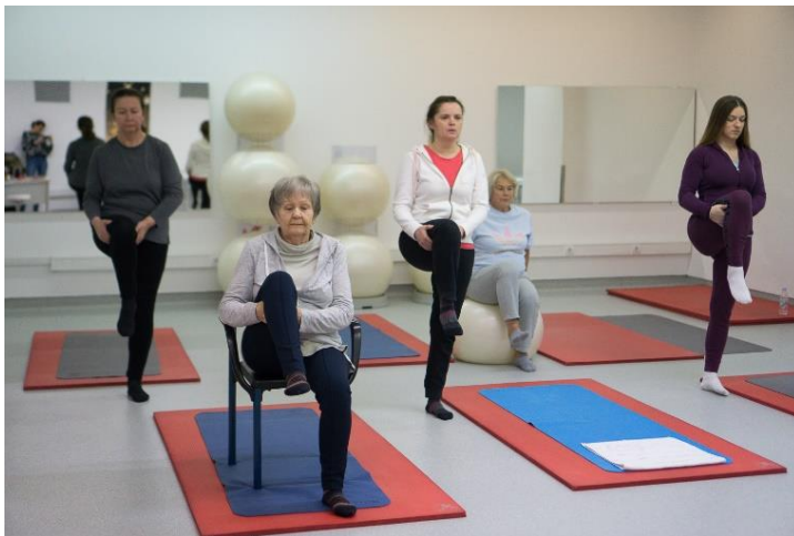
Slika 18. Pavanmuktasana

Izdišući podigne se noga savinuta u koljenu, a koljeno privuče čim više na prsa. U položaju se može zadržati neko vrijeme normalno dišući. Udišući spusti se noga na pod. Vježba se ponovi na drugu stranu.