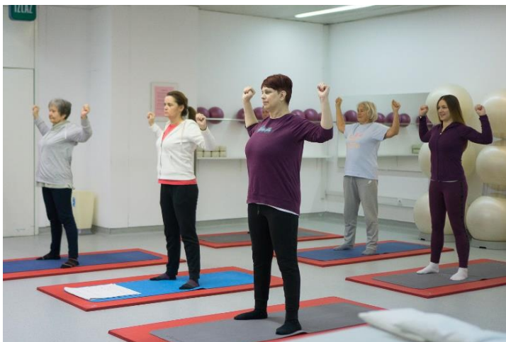
Slika 15. Istezanje prsnog koša

Ruke se podignu spojene ispred tijela do visine ramena sa savinutim laktovima. Udišući se laktovi rašire u stranu, a izdišući ponovo spajaju ispred tijela.