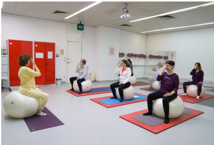
Slika 21. Nadi sodhana pranajama

Nakon završetka vježbe ruke se spuste na koljena i ponovo nekoliko minuta prati normalan dah.