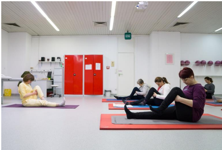
Slika 9. Pavanmuktasan

Vježba počinje iz položaja ispruženih nogu. Isprepletu se prsti ispod koljena jedne noge i ta noga izdišući savija i privlači prema tijelu. Vrat se savije prema naprijed dok glava ne dotakne koljeno. Udišući se glava podiže i ispruža noga, a izdišući se noga spušta na pod. Vježba se ponovi sa drugom nogom.