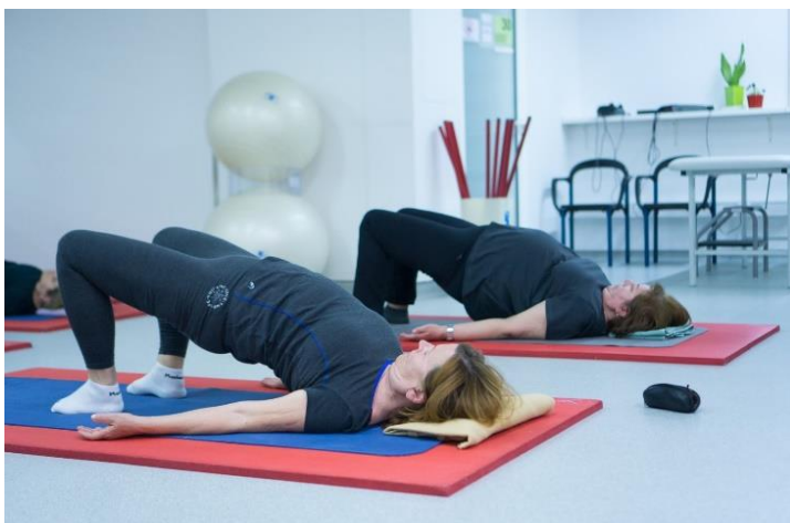
Slika 6. Skandharasana

Noge su savijene u koljenima i razmaknute za širinu kukova. Udišući se počinje podizati kralješnica, kralješak po kralješak, počevši od trtice pa prema prsnom dijelu, potom se zadrži neko vrijeme u položaju normalno dišući, a potom se izdišući spuštaju leđa na tlo.