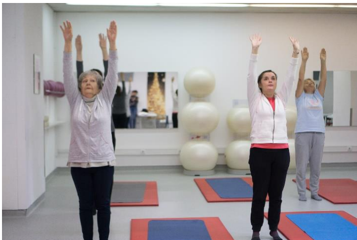
Slika 20. Istezanje tijela

Stane se spojenih nogu. Udišući se podigne na nožne prste istodobno podižući ruke iznad glave te se dobro istegne cijelo tijelo. Izdišući se vraća u početni položaj.