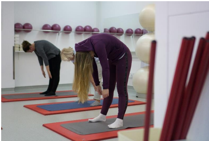
Slika 19. Sagibanje prema naprijed

Noge su u blagom raskoraku. Izdišući se polako počevši od glave, savija gornji dio tijela prema naprijed i pritom naizmjenice isteže desno pa lijevo rame ka podu. Tijekom sagibanja glava i ruke opušteno vise. Neko vrijeme se ostane u položaju, a potom polako kralješak po kralješak podiže ponovo u stojeći položaj.