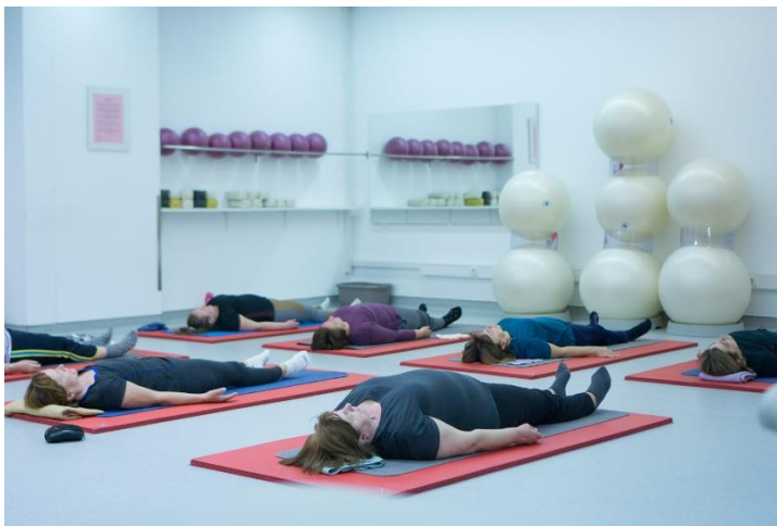
Slika 1. Vježba opuštanja u položaju Anandasana

Varijanta A. Vježba se izvodi u položaju Anandasana. To je položaj u kojem se leži na leđima, stopala su malo razmaknuta i okrenuta u stranu. Ruke su ispružene malo odmaknute od tijela, dlanova okrenutih prema gore. Oči su zatvorene, kapci opuštani. Pažnja se usmjerava na svaki dio tijela od nožnih prstiju do vrha glave te ga se svjesno, korak po korak, potpuno opušta. Anandasana se radi na početku i kraju svakog sata vježbi kao i povremeno između vježbi.