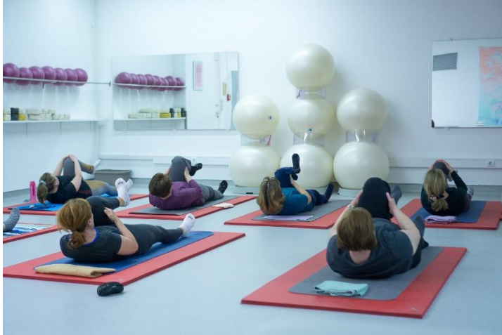
Slika 5. Pavanmuktasana

Udišući se savije koljeno, obuhvati ga se objema rukama i privuče što bliže tijelu. Suprotna noga ostaje ispružena na podu. Izdišući se podigne glava i nosom dotakne koljeno. Udišući se spušta glava, a izdišući ispruža noga. Vježba se ponavlja na drugu stranu.