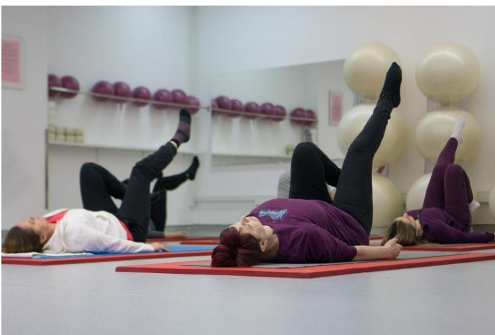
Slika 8. Vožnja bicikla

Nakon dubokog udaha podignu se oba stopala od poda, potkoljenice su usporedne s podom. Kratko se zadrži u početnom položaju. Potom se normalno dišući podignutim nogama naizmjenice rade pokreti vožnje bicikla. Napravi se prvo nekoliko krugova prema naprijed, a potom prema natrag.