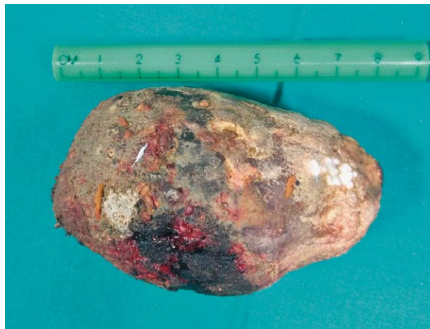
SLIKA 3. ŽUČNI KONKREMENT DULJINE 9 CM

ukupni bilirubin (6 \mu\text{mol/L} ), CRP (190.5 mg/L), u urinu Leu (3+), nitriti (1+), ketoni (2+), urobilinogen (3+). Učinjeni RTG srca i pluća bez osobitosti. Nativni CT abdomena i zdjelice prikaže pneumobiliju i opstrukciju sigmoidnog kolona intraluminalno smještenim konkrementom promjera 4,8 cm (slika 1). Nalaz