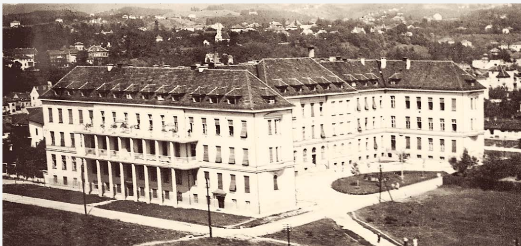
SLIKA 6. – FIGURE 6. ZGRADA KLINIKE NA ŠALATI, 1933. / THE BUILDING AT ŠALATA, 1933.