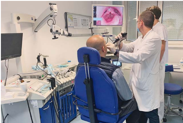
SLIKA 18. AMBULANTA NA KLINICI REBRO, 2021. FIGURE 18. THE OUTPATIENT DEPARTMENT, REBRO, 2021

ma na Rebru. Centar za audiologiju i Centar za fonijatriju preseljavaju sa Šalate 2011. godine u također nove komfornе prostore u tzv. zelenoj zgradi na Rebru. Uz navedene prostore, Klinika raspolaže sa stacionarom u tzv. „istočnom češlju“ koji ima 6 bolesničkih postelja smještenih u jednokrevetnim i dvokrevetnim sobama visokog standarda, 4 operacijske dvorane u centralnom operacijskom bloku, jednu operacijsku dvoranu u okviru Jednodnevne kirurgije (Dnevne bolnice) te prostrani prostor Poliklinike sa 6 ambulanti, ambulantom za UZV i operacijskom dvoranom za male kirurške zahvate (slika 18 i 19). Koliko se odluka o preseljenju pokazala ispravnom, potvrdio je nažalost katastrofalni potres u Zagrebu od 22. ožujka 2020. godine, čije su posljedice takva oštećenja na bivšoj zgradi Klinike na Šalati zbog kojih je predviđena za rušenje.