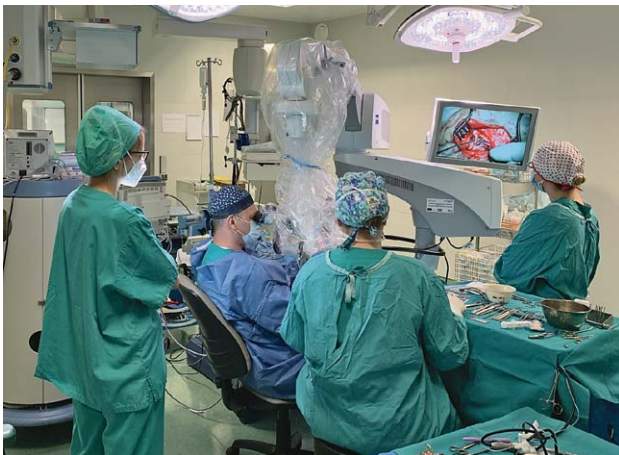
SLIKA 19. OPERACIJSKA DVORANA KLINIKE, REBRO, 2021. FIGURE 19. OPERATING ROOM, REBRO, 2021

Uz sve pogodnosti novog prostora, Klinika kadrovski jača i radi organizacijske promjene. Osnovan je, bolje rečeno, u okviru Klinike vraćen Odjel za maksilofacijalnu kirurgiju, čime Klinika stručno i znanstveno pokriva kompletnu kirurgiju glave i vrata. Formiran je