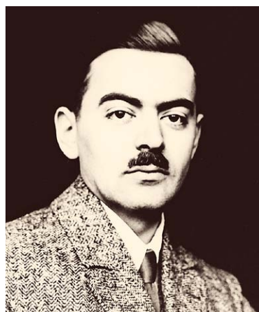
SLIKA 8. / FIGURE 8. ANTE ŠERCER

prvi s područja tadašnje Jugoslavije postao je 1929. članom elitnog društva Collegium Othorinolaryngologicum Amicitiae Sacrum – ORLAS. Godinu dana kasnije postao je članom Jugoslavenske akademije znanosti i umjetnosti, danas HAZU. Bio je dekan Medicinskog fakulteta 1936./37., 1943./44. i 1944./45. godine. Osnovao je Medicinski fakultet u Sarajevu 1944. godine. U publicistici je ostavio neizbrisiv trag. Kapitalno djelo ORL propedeutika zbir je ne samo njegovih zapažanja, nego i svjetski poznatih otorinolaringologa o različitim problemima struke. Šercer je bio svestran kada je riječ o kirurškoj vještini. U rinologiji je našao pristup hipofizi transseptalnim putem koji se upotrebljava i danas. Zapažena su njegova istraživanja o odnosu između uspravnog stava čovjeka i savijanja lubanjske baze. Učinio je fenestraciju kod otoskleroze, čime je Zagrebačka ORL klinika postala četvrta u Europi u kojoj je izvršena ova operacija. 9–11 Izveo je prvu dekortikacijsku plastiku nosa u rinologiji.