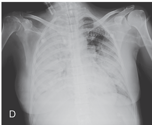
SLIKA 1. RADIOGRAM PRSNOG KOŠA PRIKAZUJE KONSOLIDIRAJUĆI INFILTRAT CIJELOGA DESNOG PLUĆNOG KRILA I LIJEVOGA DONJEG PLUĆNOG REŽNJA

FIGURE 1. THE CHEST RADIOGRAPH SHOWS A CONSOLIDATION OF THE ENTIRE RIGHT LUNG AND LEFT LOWER LUNG LOBE