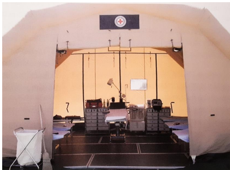
Slika 2. Improvizirana kirurška sala privremene ratne bolnice. Preuzeto i prilagođeno prema (1).

postojala je velika opasnost od izravnih napada na bolnice. Vojska je stoga u improviziranim uvjetima, koristeći daske, vreće pijeska i sl. nastojala zaštititi same objekte od granatiranja te organizirala cjelodnevnu stražu koja je bila zadužena za zaštitu, sigurnost ranjenika i medicinskog osoblja (1).