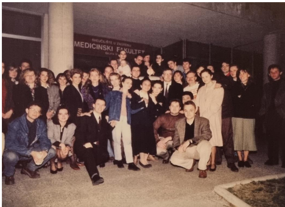
Slika 4. Studenti i mladi liječnici Sanitetskog voda i Kabineta vještina s dekanom Medicinskog fakulteta prof. dr. sc. Ivicom Kostovićem ispred zgrade dekanata Medicinskog fakulteta Sveučilišta u Zagrebu, ožujak 1992. godine. Preuzeto i prilagođeno prema (1,3).