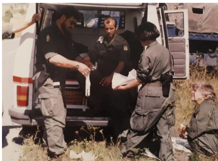
Slika 1. MKE na Plitvicama, 1995. Preuzeto i prilagođeno prema (1,3).

U pojedinim slučajevima kad je njihovo djelovanje bilo ograničeno, kao što je u slučajevima kad je postojala velika opasnost od granatiranja koja je onemogućavala pružanje sanitetske skrbi, bili su smješteni u improviziranim skloništima unutar kojih su bile postavljene i improvizirane operacijske sale. Sigurnost zbog blizine koju su im pružali, bilo je od velike psihološke potpore svim braniteljima. MKE su brojale 650 članova. Od toga je bilo 300 liječnika specijalista, 300 medicinskih sestara/tehničara i 50 vozača. Kad nisu bili na terenu, obavljali su svoju dužnost unutar svojih civilnih, matičnih ustanova. Svaka opća bolnica je imala obavezu ustrojiti 2 MKE, klinička bolnica 3 MKE i klinički bolnički centar 4 MKE. Osim po zapovjedi GSS RH, velik broj timova je organiziran spontano, na terenu. MKE su jedne od najzaslužnijih za veliki uspjeh hrvatskog ratnog saniteta, a dokaz tome je i činjenica da su postale uzorom brojnim svjetskim sanitetima (1). U radu MKE-a sudjelovale su ekipe i dragovoljci iz MF-ovih nastavnih baza, a uz njih su i studenti fakulteta imali bitnu ulogu u edukacijama.