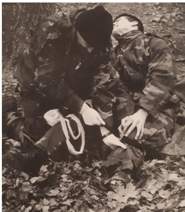
Slika 3. Specijalni tečaj samozbrinjavanja za SJP „Alfa” na Sljemenu, 1993. Preuzeto i prilagođeno prema (1,3).

Edukacije i vježbe su provođene od strane iskusnih kirurga na Medicinskom fakultetu u Zagrebu i na Sljemenu (1). Osim edukacije liječnika, provođene su edukacije ostalih hrvatskih branitelja koji su kroz kratke tečajeve i simulacijske edukativne snimke savladali nužne, početne vještine koje su ponekad bile presudne i od životne važnosti. Članovi MKE su provodili i edukacije na bojišnici za vojnike-borbene spasioce. Kao rezultat velikog zalaganja i interesa nastavnika Medicinskog fakulteta u Zagrebu, proizašao je i prvi priručnik „Hrvatska ratna kirurgija” namjenjen svima i distribuiran u sve zdravstvene centre diljem zemlje. Kasnije su nastale i brojne druge brošure, pravilnici i nautci koji su bili bitni za bolje zbrinjavanje ranjenika i na razini primarne zdravstvene zaštite (1).