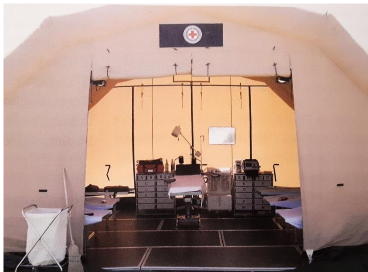
Slika 2. Improvizirana kirurška sala privremene ratne bolnice. Preuzeto i prilagođeno prema (1).

postojala je velika opasnost od izravnih napada na bolnice. Vojska je stoga u improviziranim uvjetima, koristeći daske, vreće pijeska i sl. nastojala zaštititi same objekte od granatiranja te organizirala cjelodnevnu stražu koja je bila zadužena za zaštitu, sigurnost ranjenika i medicinskog osoblja (1).