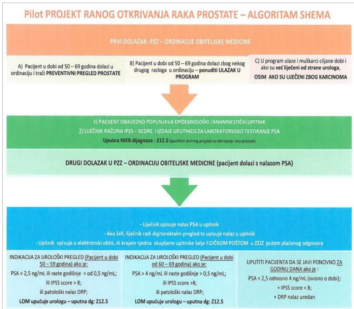
Slika 1: Shema pilot projekta ranog otkrivanja karcinoma prostate

ng/ml ili IPSS zbrojem >8 ili patološki DRP nalaz. Svi upitnici su slani u Zavod za javno zdravstvo Varaždinske županije na upis, bez obzira na indikaciju za pregled urologa. Pacijente s indikacijom moglo se naručiti telefonski na urološki pregled s minimalnom odgodom od 15 dana od kompletiranja upitnika. Podatke svih upitnika preuzeli smo sa centralnog bolničkog informatičkog sustava OB Varaždin (IBIS). Radi se o sustavu koji je preko korisničkog imena i lozinke koju dodjeljuje bolnica dostupan svim liječnicima obiteljske medicine (LOM) u Varaždinskoj županiji kako bi imali uvid u nalaze onih pacijenata koje su oni uputili na pregled u bolnicu. Svaki LOM ima uvid u medicinsku dokumentaciju samo onih pacijenata koji se nalaze na njegovoj listi, no postoji i dio o preventivnim pregledima, koji je dostupan svim liječnicima. Podatke o broju i rezultatu biopsija provedenih na Urološkom odjelu u OB Varaždin ustupili su nam liječnici koji su ih provodili.