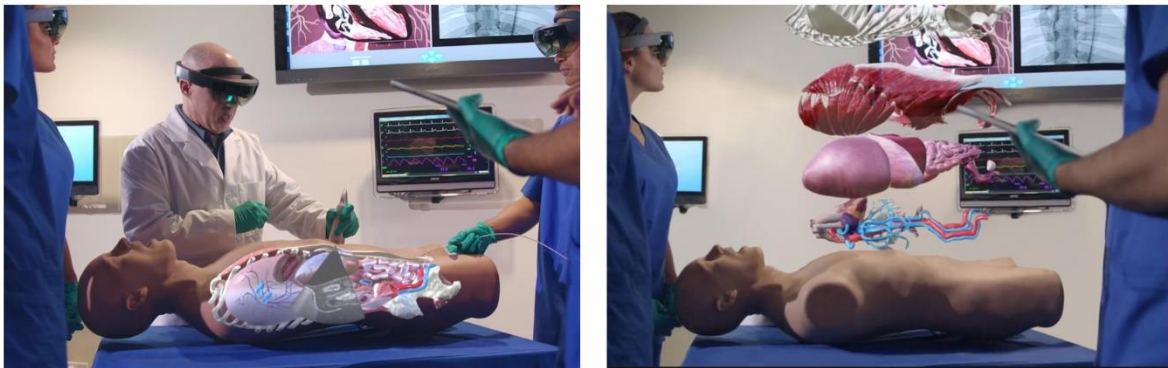
Slika 6: Prikaz upotrebe Microsoft Hololens™ tehnologije u kreiranju virtualne stvarnosti na modelu lutke za dijagnostički ultrazvuk.

generira specifično okruženje, pacijent te bilo koja promjena ili mjesto koji su potrebni za simulaciju. Dodatak audio-vizualnih te haptičkih (taktilnih) senzora omogućuje korisniku stvaran osjećaj slike, zvuka, dodira, a u novije vrijeme i mirisa. Nedostatak je za sada cijena i početak razvoja tehnologije te njene primjene koja je za sada u području medicinske simulacije zastupljena od strane nekoliko proizvođača, uključujući i Microsoft sa tehnologijom Hololens™.