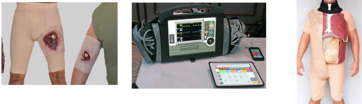
Slika 3: Hibridni simulatori koji se integrišu na postojeći model ili čovjeka