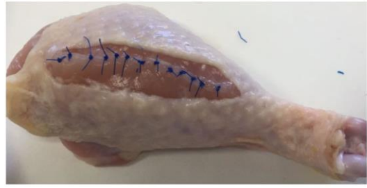
Slika 7: Prikaz stvarnih modela koji se mogu koristiti u edukaciji