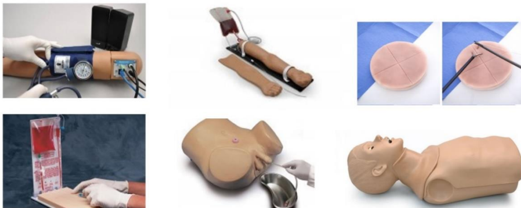
Slika 1: Primjerci modela za trening vještina