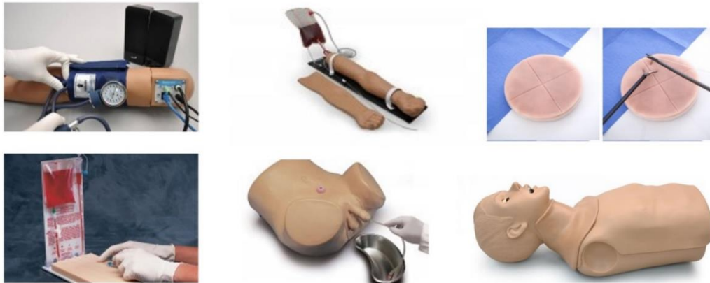
Slika 1: Primjerci modela za trening vještina