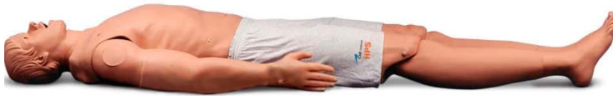
Slika 4: HPS™ (Human Patient simulator). Napredni simulator za anesteziju