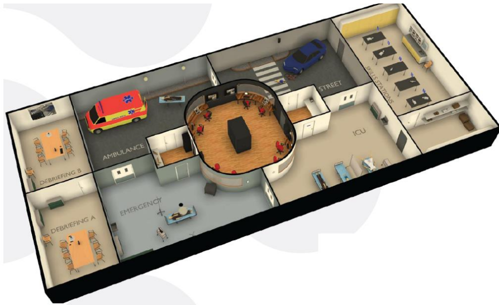
Slika 9: Primjerak arhitektonske izvedbe modernog simulacijskog centra