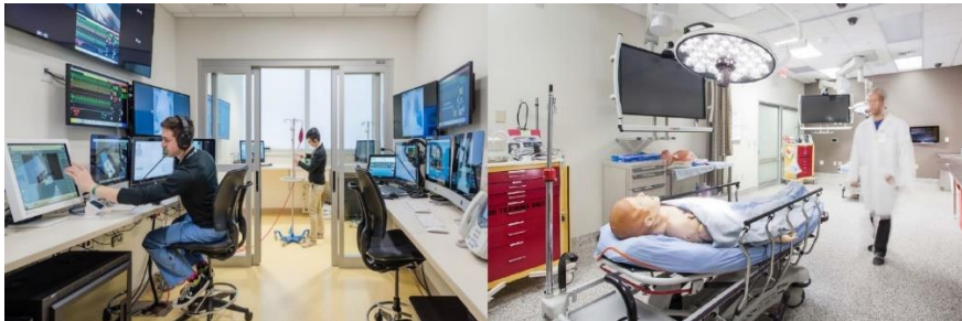
Slika 8: Prikaz aktivnosti rada modernog simulacijskog centra

tržištu medicinske edukacije. Kroz najam opreme, prostora i stručnog osoblja, centar može biti dodatni izvor prihoda ustanovi ili pojedincu koji ga vodi.