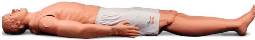
Slika 4: HPS™ (Human Patient simulator). Napredni simulator za anesteziju