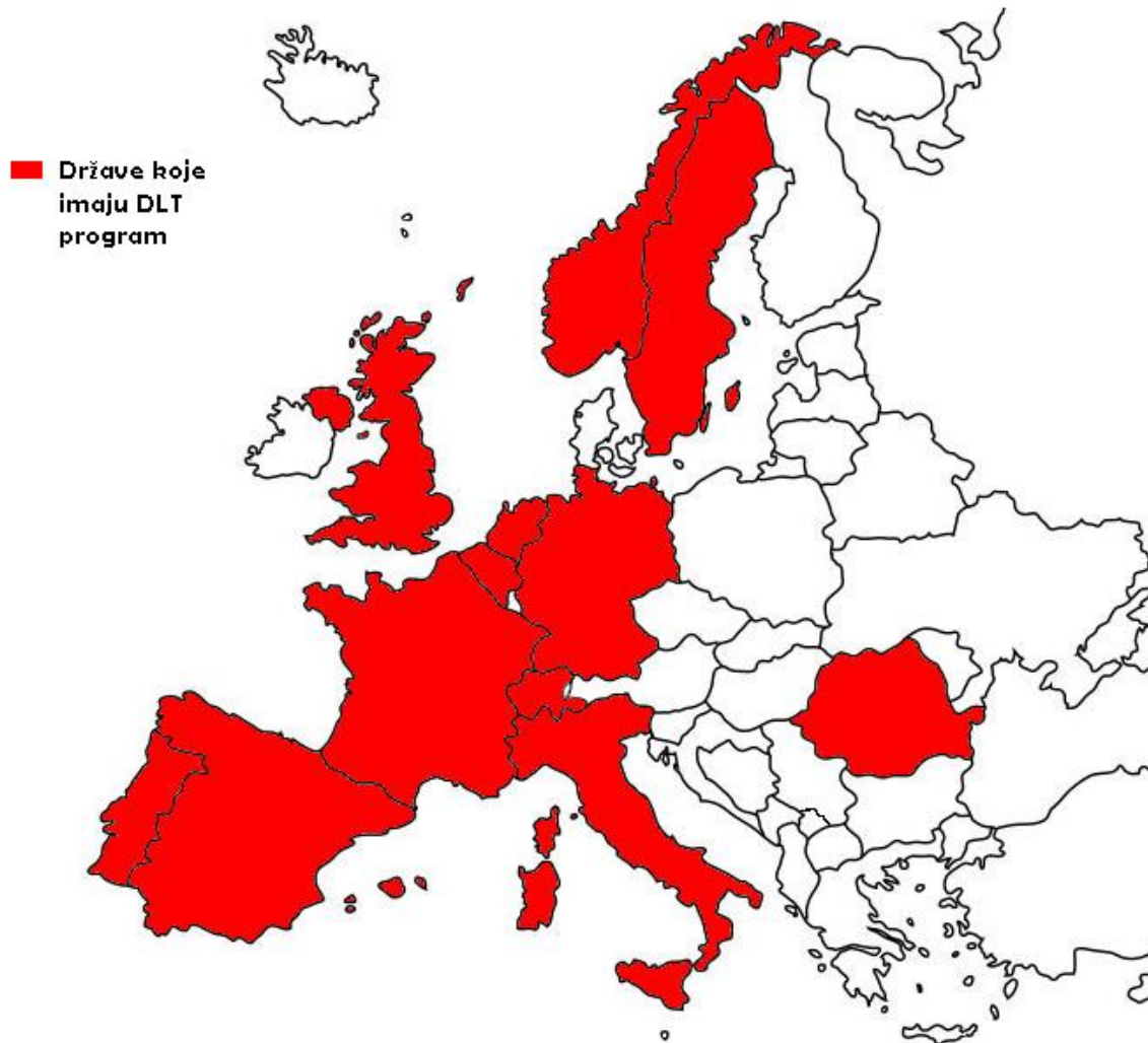
Slika 2. Prikaz europskih država s programom DLT-a (prema Domino Liver Transplant Registry , http://www.fapwtr.org/ram_domino.htm , ažurirano 31.12. 2017.).

proširila na 66 transplantacijskih centara u 21 državi (11). Domino transplantacije jetre se, prema Domino Liver Transplant Registry -u, najviše vrše u Portugalu, Francuskoj i Švedskoj, dok neke države nemaju program domino transplantacija uključujući i Hrvatsku (12).