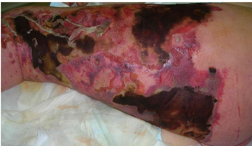
Slika 5. Nekrotizirajući fascitis.

Nekrotizirajući fascitis liječi se hitnom operacijom. Što se prije operira ishod je povoljniji. Operacija zahtijeva opsežni široki debridman svih nekrotičnih tkiva. Rani kirurški zahvati mogu smanjiti gubitak tkiva i eliminirati potrebu za amputacijom gangrenoznog ekstremiteta. Širokim debridmanom, rane treba ostaviti otvorenima i napuniti ih mokrim gazama. Svakodnevne zamjene su obavezne. Hemodinamska stabilnost se najčešće uspostavlja nakon uklanjanja nekrotičnog tkiva i gnoja. Pacijenta po potrebi treba intubirati i nadzirati u jedinici za intenzivno liječenje. Tijekom operacije, posebnu pozornost treba posvetiti hemostazi. Neki pacijenti mogu zahtijevati ponovljene operacije radi uklanjanja nekrotičnog tkiva. Nakon uklanjanja nekrotičnog tkiva često je potrebna i rekonstrukcija tkiva u konzultaciji s plastičnim kirurgom. Potrebno je i rano empirijsko liječenje antibiotikom širokog spektra. Identifikacijom patogena antibiotik se korigira prema antibiogramu. (55)