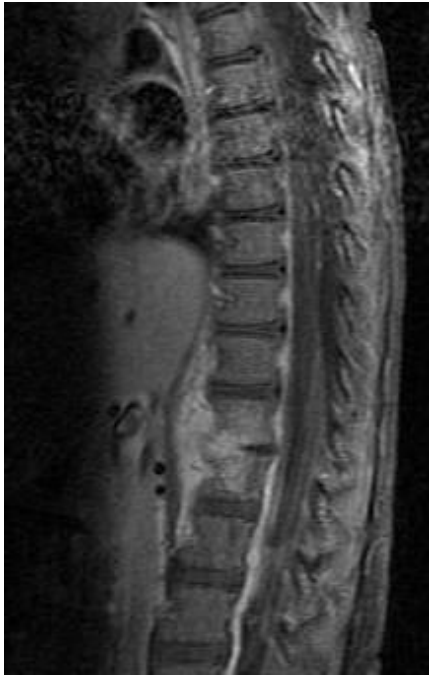
Slika 4. MR prikaz discitisa dvogodišnjeg djeteta.