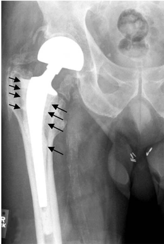
Slika 2. Aseptičko razlabavljenje proteze kuka. Vidljiva periprotetička osteoliza, strelice prikazuju cement koji okružuje protezu.