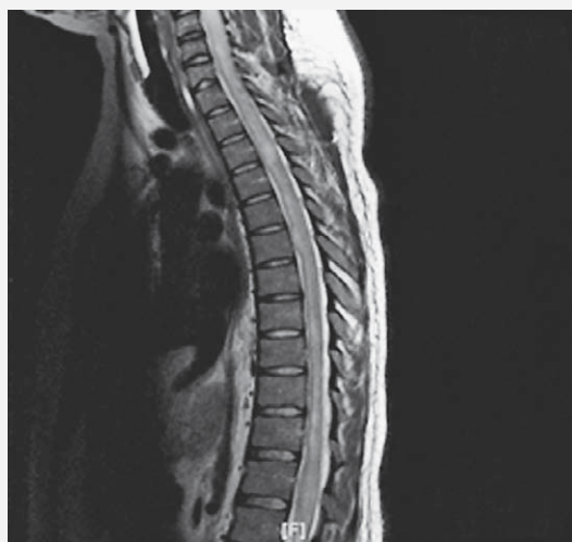
SLIKA 2. LETM JE U TRENTKU DIJAGNOZE ZAHVATIO SVE SEGMENTE KRALJEŽNIČNE MOŽDINE.

FIGURE 1. DIFFUSE SPINAL CORD EDEMA, THE MOST VISIBLE IN THE AREA OF CRANIOCERVICAL JUNCTION AND THE CERVICAL SEGMENT, AS IT COULD BE SEEN ON THE INICIAL MR – IMAGE AT THE MOMENT OF LETM DIAGNOSIS.