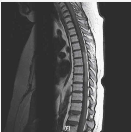
SLIKA 3. MR NAKON ŠEST CIKLUSA CIKLOFOSFAMIDA POKAZUJE DJELOMIČNU REGRESIJU PATOLOŠKIH PROMJENA U CERVICALNOJ MEDULI, KAO I DALJNJU DJELOMIČNU REGRESIJU OPSEŽNE ZONE TRANSVERZALNOG MIJELITISA KOJI ZAHVAĆA SEGMENTE Th1 DO Th10.

FIGURE 3. MR AFTER SIX CYCLOPHOSPHAMIDE CYCLES REVEALS PARTIAL REGRESSION OF PATHOLOGICAL CHANGES CONFINED TO CERVICAL SPINAL CORD, ALONG WITH FURTHER PARTIAL REGRESSION OF EXTENSIVE AREA OF TRANSVERSE MYELITIS AFFECTING FIRST TEN THORACIC VERTEBRAL SEGMENTS.