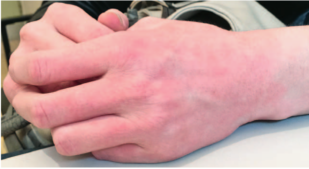
SLIKA 4. KONTAKTNI ALERGIJSKI DERMATITIS NA GUMENE ZAŠTITNE RUKAVICE