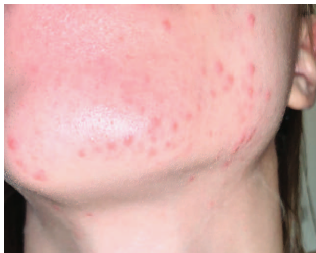
SLIKA 3. NOVONASTALA AKNE ZBOG OKLUZIVNOG UČINKA MASKE

FIGURE 2. AGGRAVATION OF PRE-EXISTING ACNE DUE TO THE OKCLUSIVE EFFECT OF A PROTECTIVE MASK