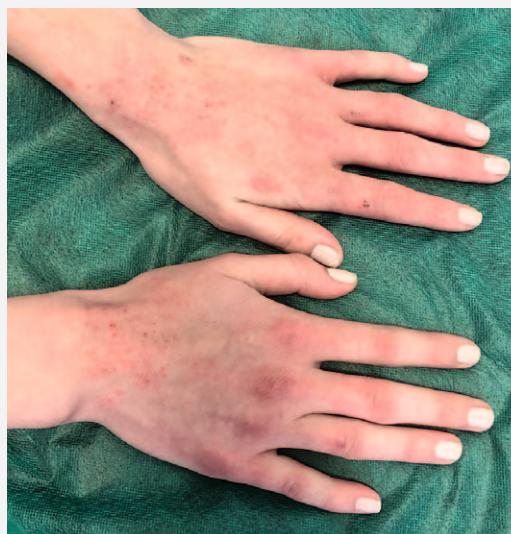
SLIKA 1. KONTAKTNI IRITATIVNI DERMATITIS U BOLESNICE S ATOPIJSKIM DERMATITISOM KOJI JE NASTAO KAO POSLJEDICA PROLONGIRANOG NOŠENJA ZAŠTITNIH RUKAVICA

Dugotrajno nošenje zaštitnih rukavica povezano je s okluzijom, znojenjem i maceracijom kože, što oštećuje zaštitnu epidermalnu barijeru i čini kožu šaka osjetli-