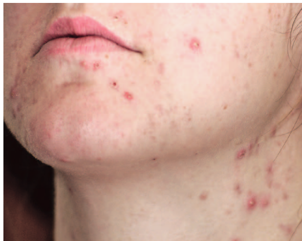
SLIKA 2. POGORŠANJE VEĆ POSTOJEĆE AKNE ZBOG OKLUZIVNOG UČINKA MASKE

Acne vulgaris jedna je od najčešćih dermatoloških bolesti i njena se patogeneza temelji na međusobnoj interakciji četiriju glavnih čimbenika: folikularne hiperkeratinizacije, povećanog stvaranja sebuma, upale i proliferacije bakterije Cutibacterium acnes . 27 No, kada govorimo o utjecaju nošenja zaštitne opreme, bitno je naglasiti da su kontinuirani pritisak na kožu i pojava trenja dokazani kao odlučujući čimbenici u etiologiji ovog tipa acne jer uzrokuju okluziju pilosebacealnih folikula u osoba koje otprije boluju od acne vulgaris (slika 2). 24 Nadalje, smatra se da nošenje maski s filterom (npr. maski N95) uzrokuje pojavu toploga i vlažnoga aerosola u predjelu lica koji je pokriven maskom, a takav okoliš idealan je ne samo za pojavu acne , nego i za brojne druge dermatoze. 15 Kod zdravstvenih radnika koji nisu imali dijagnozu acne vulgaris u svojoj