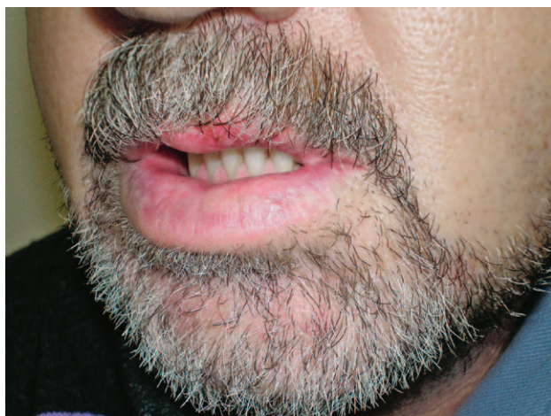
SLIKA 7. CHELITIS NASTAO USLIJED DEHIDRACIJE KAO POSLJEDICA PROLONGIRANOG NOŠENJA MASKE FIGURE 7. CHELITIS CAUSED BY DEHYDRATION DUE TO THE PROLONGED USE OF A FACE MASK