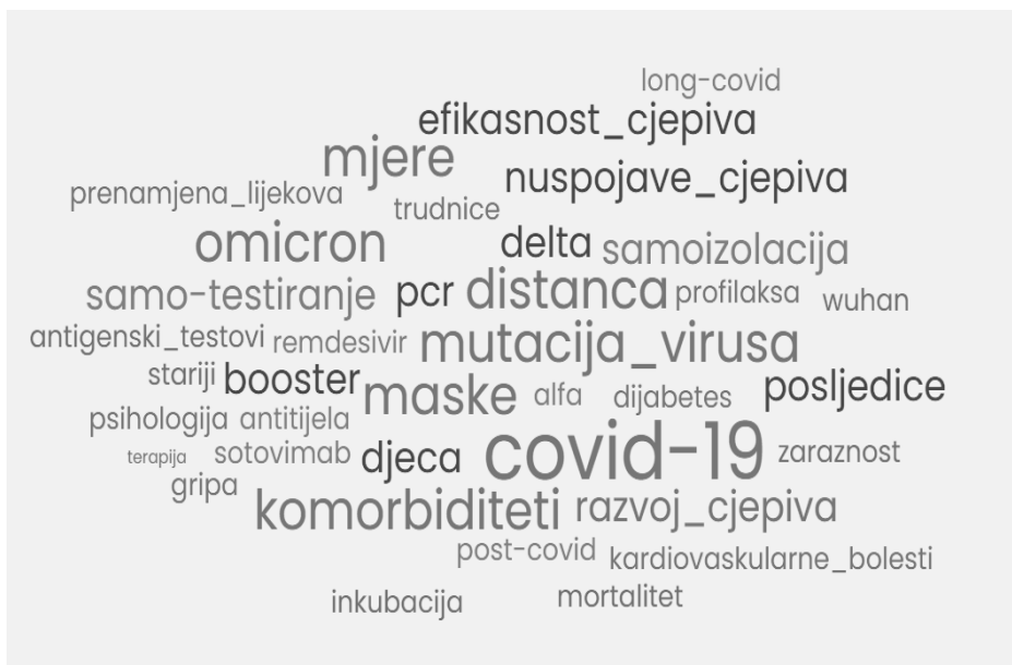
Slika 3. Grafički prikaz najčešćih tema probira literature za potrebe Ministarstva zdravlja

U prosincu 2021. godine suradnja knjižničara iz SMK-a s Ministarstvom zdravlja formalizirana je. Osnovana je Radna skupina za praćenje i obradu stručnih i znanstvenih radova vezanih uz epidemiju bolesti COVID-19. Voditeljica osmeročlane radne skupine istaknuta je profesorica zagrebačkog Medicinskog fakulteta, ravnateljica Škole narodnog zdravlja „Andrija Štampar“, koordinatorica je savjetnica ministra zdravlja, a članovi voditelj i djelatnici Hrvatskog zavoda za javno zdravlje te tri knjižničarke s Medicinskog fakulteta Sveučilišta u Zagrebu (dvije su autorice ovog teksta, a treća voditeljica knjižnice ŠNZ „Andrija Štampar“). Tijekom tjednih virtualnih sastanaka dogovaraju se zadaci prema kojima knjižničarke jednom tjedno isporučuju tražene informacije. Područje interesa radne skupine mijenja se s obzirom na tijek pandemije. Zastupljenost pojedinih tema grafički je prikazana na slici 3. Osim klasičnog pretraživanja odabranih specijaliziranih baza podataka, časopisa i mrežnih stranica, knjižničarke rade i detaljan probir među pronađenim informacijama, utvrđujući one najznačajnije koje donose nove informacije i imaju visoku dokaznu snagu.